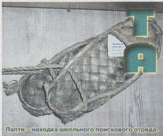
Лапти – находка школьного поискового отряда.