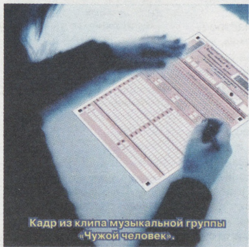
Кадр из клипа музыкальной группы «Чужой человек».