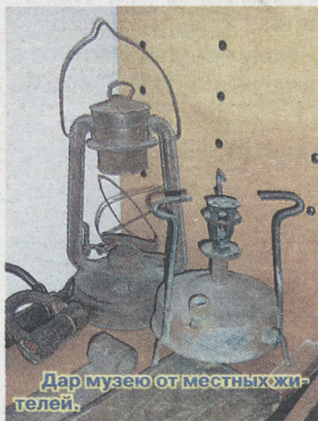
Дар музею от местных жителей.