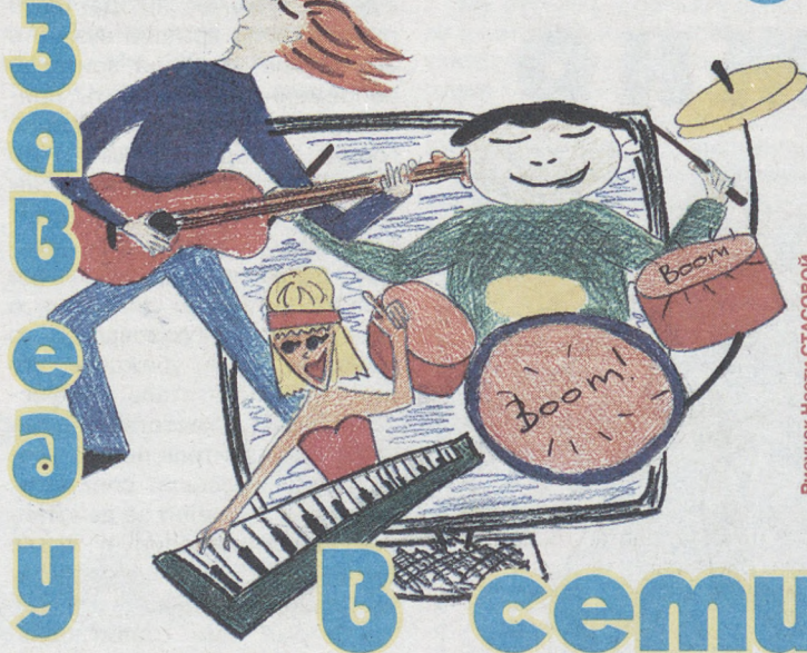
Рисунок Насти СТАСОВОЙ.

компьютером, в Интернете, нужно везде. Так что, если кто-то хочет сам создать сайт, этого не стоит бояться. Надо просто изучать информатику.