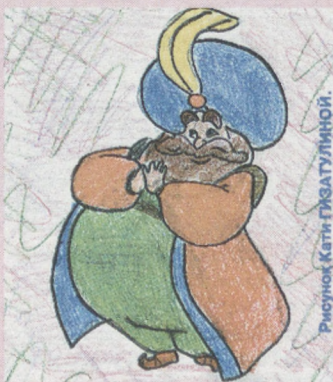
Рисунок Кати ГИЗАТУЛИНОЙ.

Вместе с классом мы сходили в екатеринбургский Театр юного зрителя на спектакль «Волшебная лампа Аладдина». Прозвенел третий звонок, и все расселись по своим местам. Заиграла быстрая музыка. Началось представление.