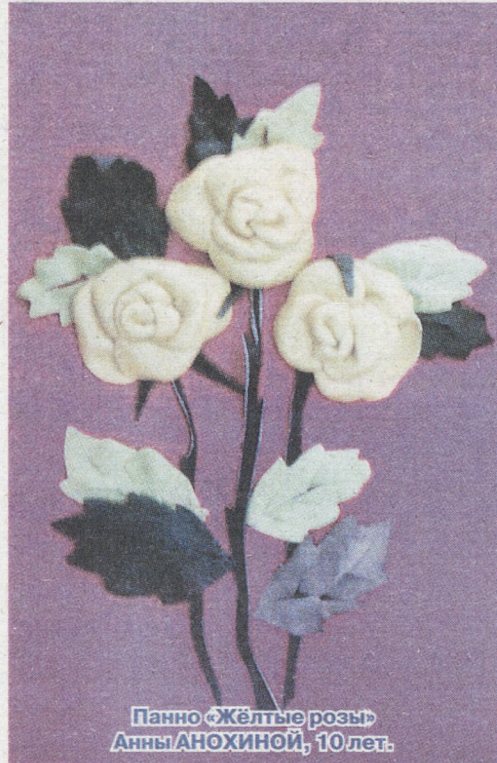
Панно «Жёлтые розы» Анны АНОХИНОЙ, 10 лет.