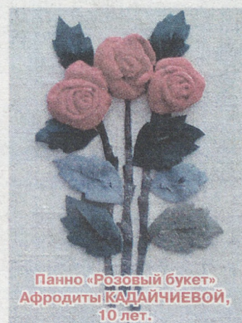
Панно «Розовый букет» Афродиты КАДАЙЧИЕВОЙ, 10 лет.