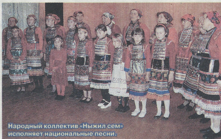
Народный коллектив «Ныжил сем» исполняет национальные песни.