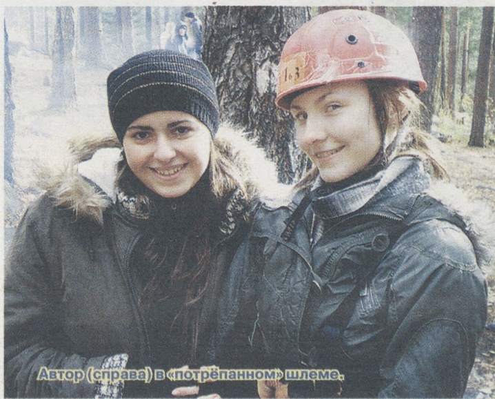
Автор (справа) в «потрёпанном» шлеме.

Перед тем как отправляться покорять скалы, нам рассказали о снаряжении, о технике безопасности. Некоторые вещи оказались очевидны, но выдали и пару интересных фактов — например, чем ближе к скале прижимаешься, тем легче подниматься, что беречь в первую очередь необходимо голову и колени. Для равновесия