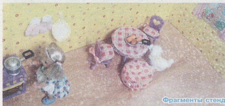
Фрагменты стенда по противопожарной безопасности.