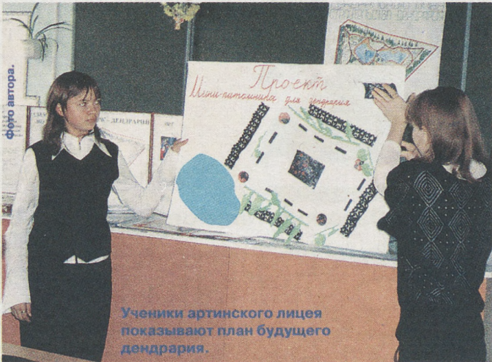
Ученики артинского лицея показывают план будущего дендрария.

тово: администрация предоставила два гектара земли, ребята горят идеей, но... Нет денег на ограждения.