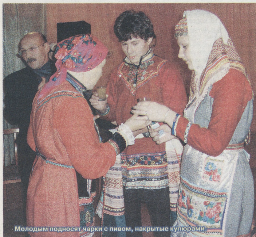
Молодым подносят чарки с пивом, накрытые купюрами.