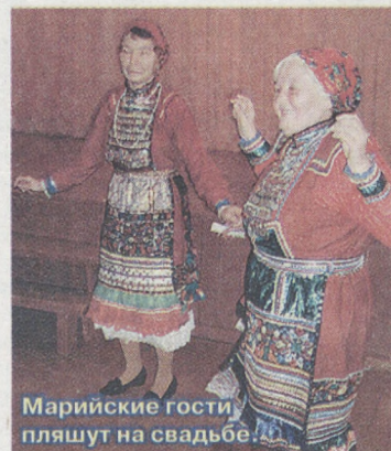
Марийские гости пляшут на свадьбе.

Конечно, свадебные обряды, которые нам показали, весьма поверхностны. В настоящих свадебных гуляньях куда больше обычаев, традиций. Но нагулялись, насмеялись, напелись и наплясались участники туристического тура вдоволь.