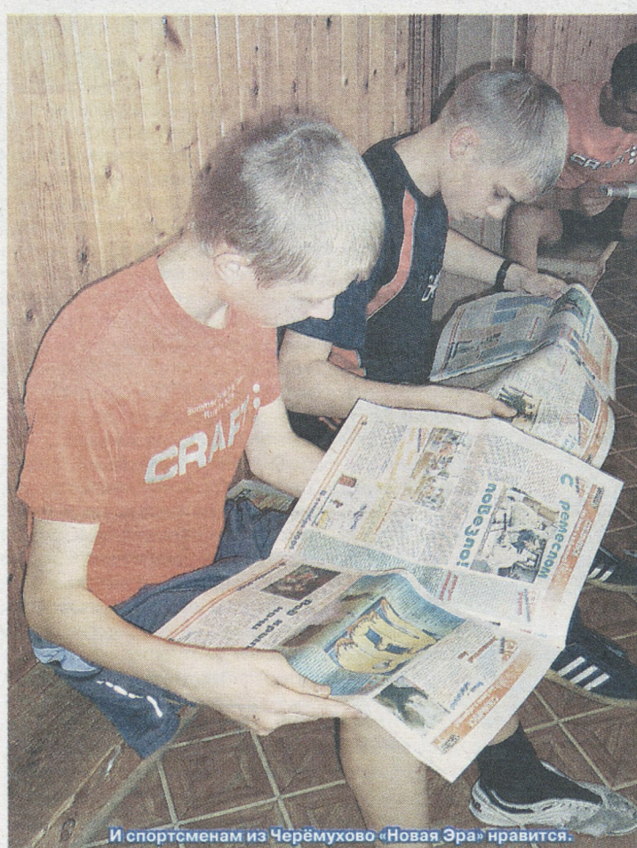
И спортсменам из Черёмухово «Новая Эра» нравится.