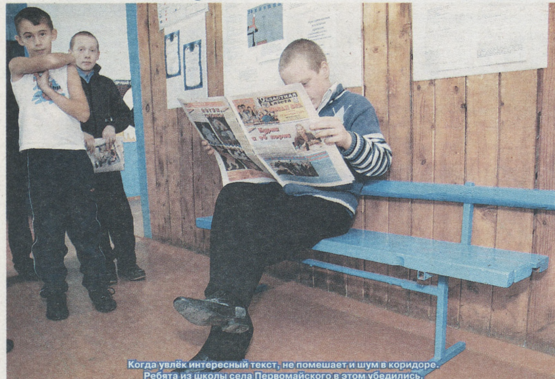
Когда увлечён интересный текст, не помогает и шум в коридоре. Ребята из школы села Первомайского в этом убедились.