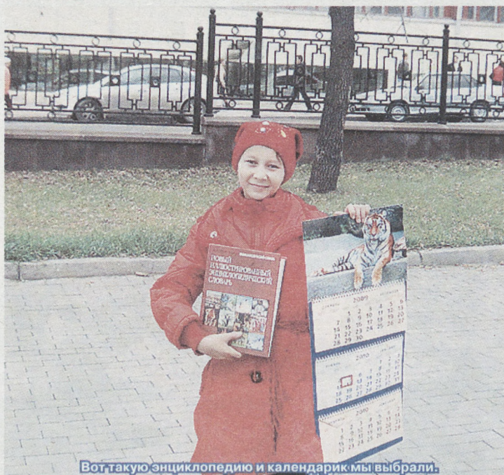
Вот такую энциклопедию и календарик мы выбрали.

Потом мы пошли в музей. По дороге встретили милого Чебурашку, увидели памятник