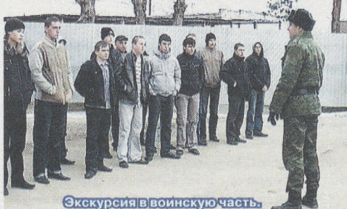
Экскурсия в воинскую часть.

Со словами напутствия и поддержки к ребятам обратились руководители города и головного предприятия ОАО «Уралэлектромедь», представители общественных организаций и духовенства.