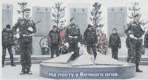
На посту у Вечного огня.

подаривших волнующую песню о верной службе матушке России. Связующей нитью прошлым и будущим поколением, данью славы и вечной памяти солдатам-землякам, погибшим на полях сражений, было возложение цветов к Вечному огню.