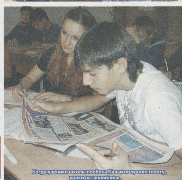
Когда ученики школы посёлка Калы получили газету, уроки остановились.

Фото авторов и Александра ТИМАКОВА, коллаж Евгения СУВОРОВА.