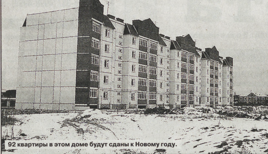
92 квартиры в этом доме будут сданы к Новому году.