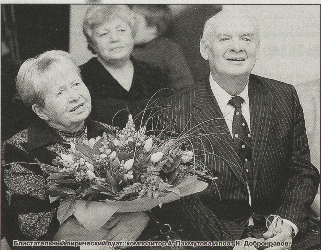
Блистательный лирический дуэт: композитор А. Пахмутова и поэт Н. Добронравов.

попурри на лирико-патриотические песни А. Пахмутовой, никто из молодых, сидевших в юрии, не нашёл убедительных аргументов «против». Её мелодии и пафос ничуть не тронуты тленом (разве что слова жёстко привязаны к тому времени). Непостижимым образом и сегодня слушатели, поют, трогают сердца пахмутовские «Геологи», «Главное, ребята, сердцем не стареть», «Прощание с Братском». То, что на языке музыкантов называется «индивидуальной интонаци-