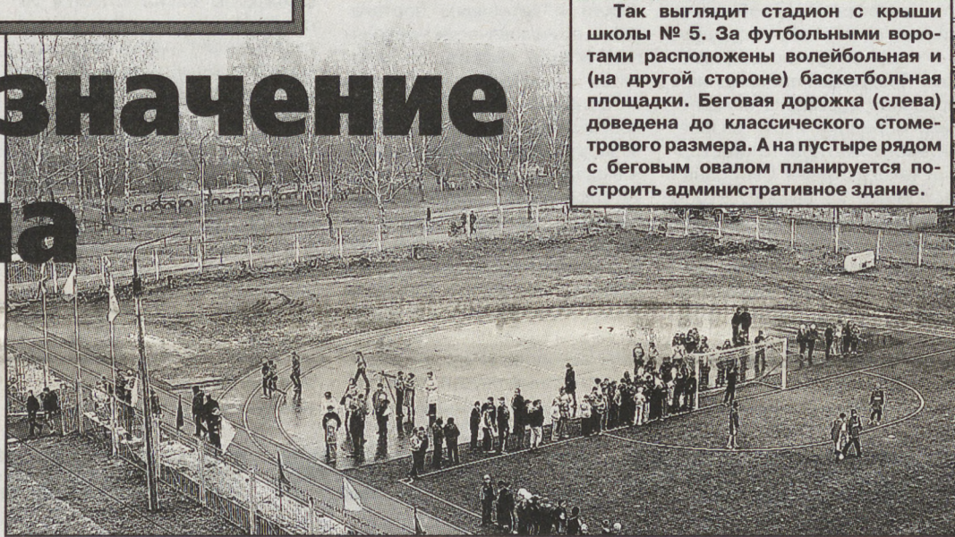
Так выглядит стадион с крыши школы № 5. За футбольными воротами расположены волейбольная и баскетбольная площадки. Беговая дорожка (слева) доведена до классического стометрового размера. А на пустыре рядом с беговым овалом планируется построить административное здание.

– Я увидел, что вратарь сместился в один угол, и не входя в штрафную, пробил в другой, – вполне профессионально разобрав ситуацию юный голговер. – Приходилось ли играть на таком покрытии? Да, в Нижнем Тагиле. Здорово, что и у нас теперь есть такое. Кто больше всех нравится из взрослых футболистов? Фернандо Торрес – нападающий «Ливерпуля» и сборной Испании. Дав первое в своей жизни ин-