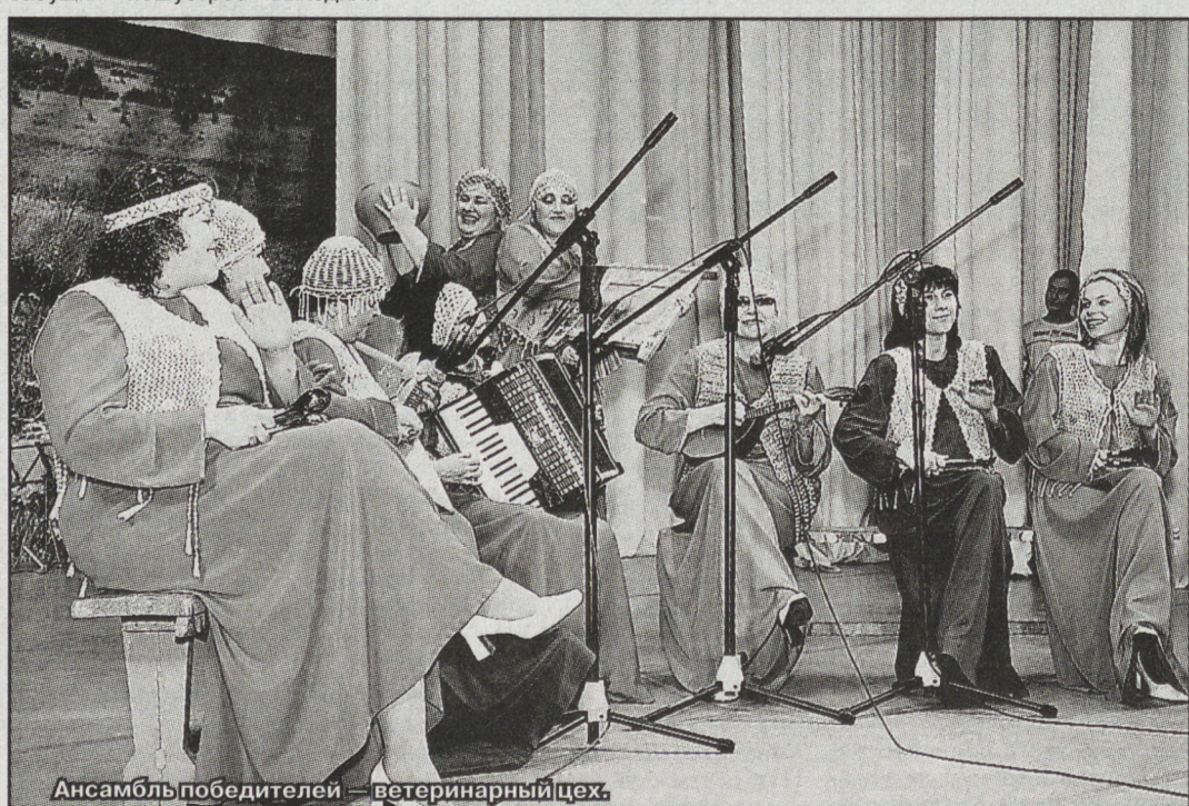
Ансамбль победителей – ветеринарный цех.