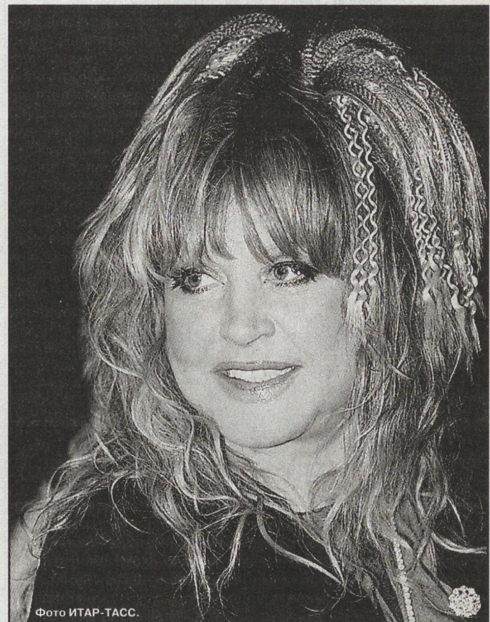
С этой песни начался прощальный концерт Аллы Пугачёвой в Екатеринбурге. «Беспрецедентное Кремлёвское шоу» прошло в воскресенье во Дворце игровых видов спорта, главная арена которого изменилась до неузнаваемости.

Несмотря на дороговизну билетов (от двух тысяч в секторах до 25 тысяч в специальной обустроенном партере) желающих в последний раз живьем лицезреть и слышать примадонну, нашлось предостаточно: ДИВС был практически полон. И не только екатеринбуржцы, солидный зрительский вклад внесла Тюменская и другие соседние области. Но даже несмотря на это, респектабельный партер всё же зиял пустотами, блеском нарядов не поразил, удивил разве что роскошью цветочных композиций. Обещанный организаторами «БМВ от Примадонны» таки разыграли. Но как-то буднично и обыденно: подошла девочка из числа зрительниц, вытащила номерок с местом