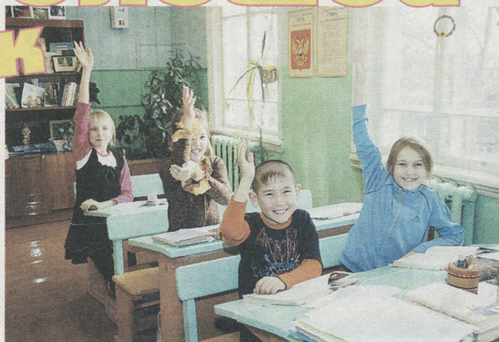
Желающих поздравить учителей хоть отбавляй.

«Новая Эра» присоединяется к поздравлениям, желает учителям здоровья, энергии и вдохновения. Мы верим, что рассказы о вас и вашей работе будут продолжать радовать нас. С праздником, дорогие учителя!