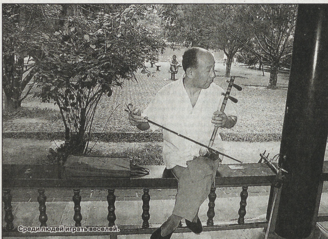
Среди людей играть веселей.