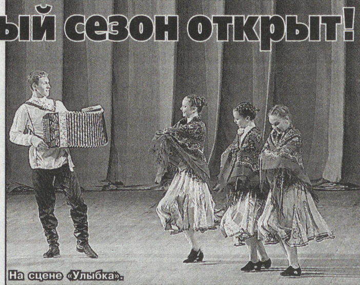
На сцене «Улыбка».

Лето у коллективов Детской филармонии было тоже насыщенным. Капелла мальчиков и юношей гастролировала по городам Польши, «Улыбка» участвовала в Международном фестивале «Ода миру» в городе Пенглай по приглашению Китайской ассоциации федераций и клубов ЮНЕСКО. Русские танцы «Калинка», «Чоботуха», «Не-