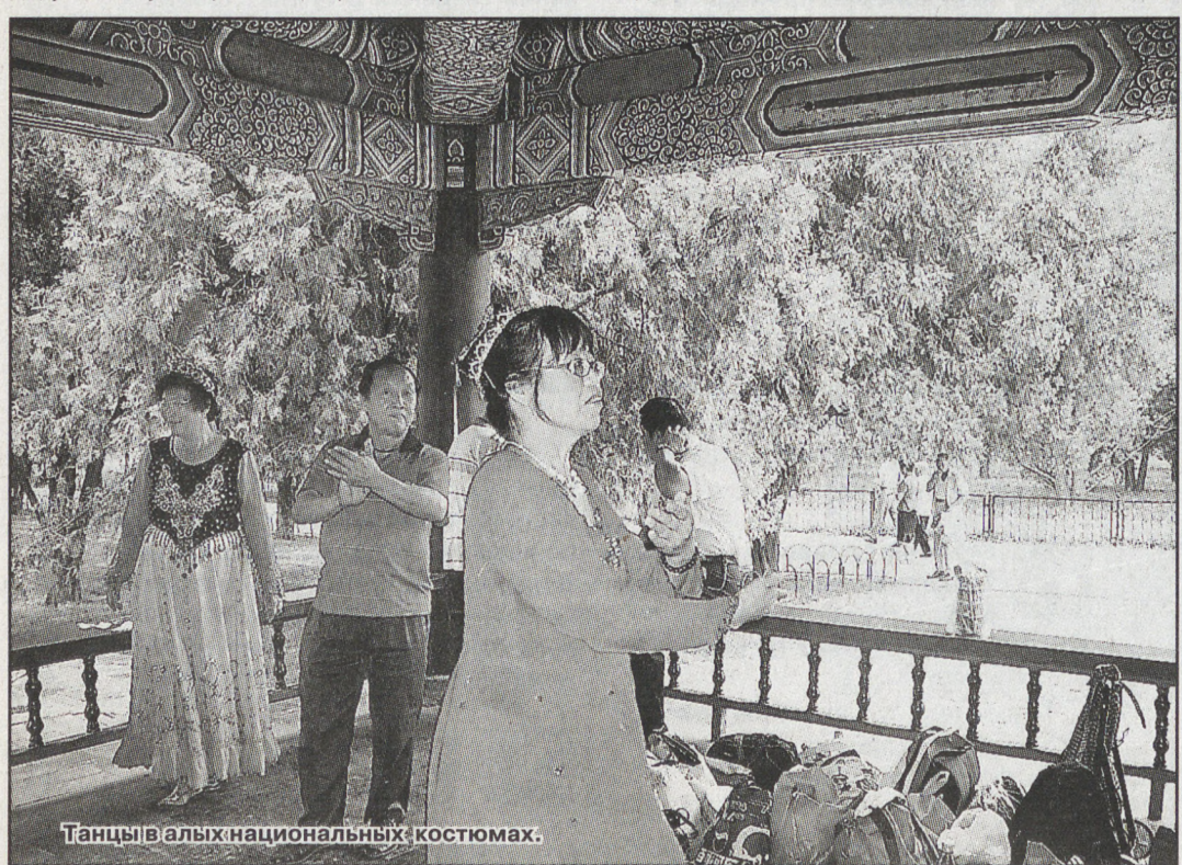
Танцы в алых национальных костюмах.