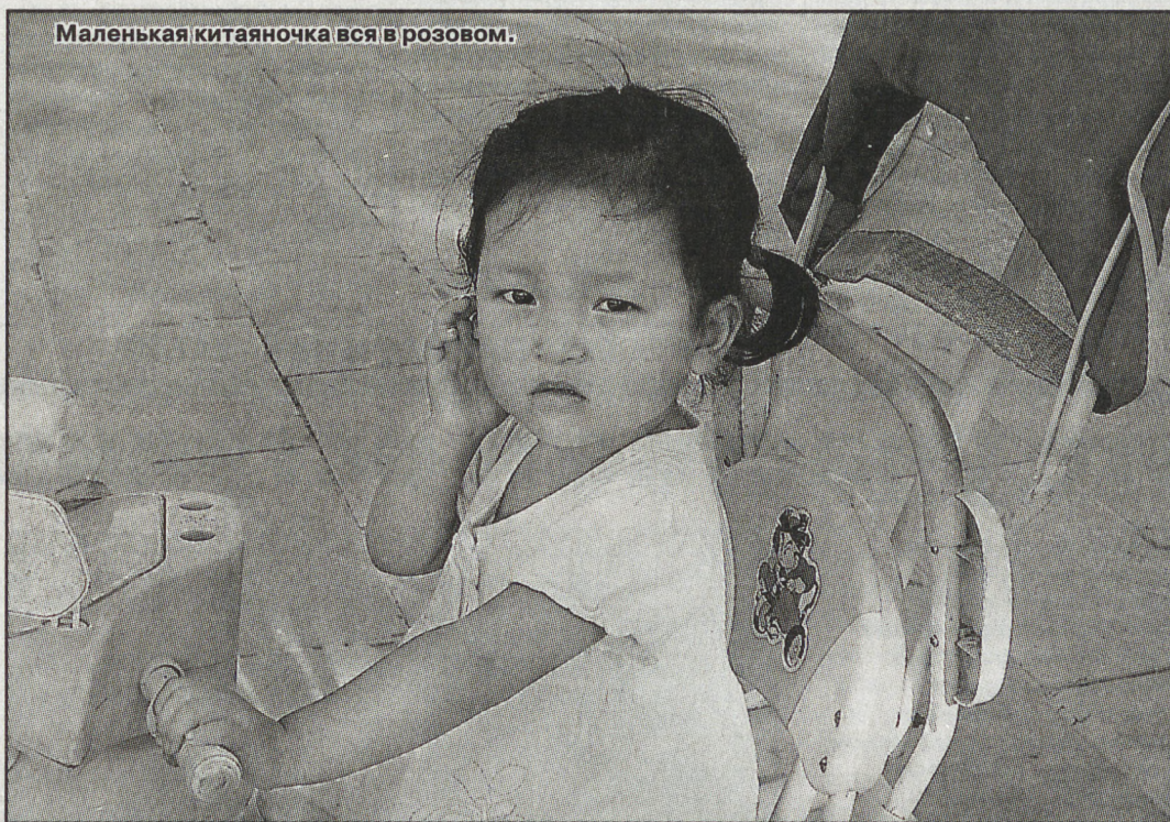
Маленькая китаяночка вся в розовом.