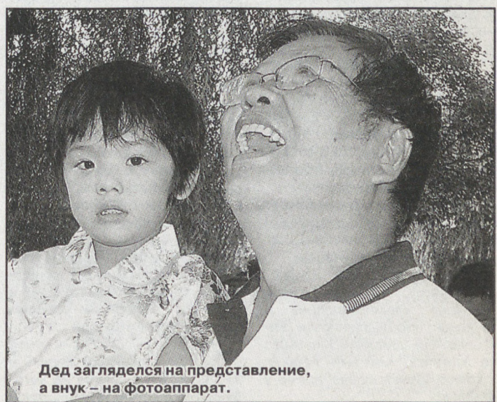
Дед загляделся на представление, а внук – на фотоаппарат.