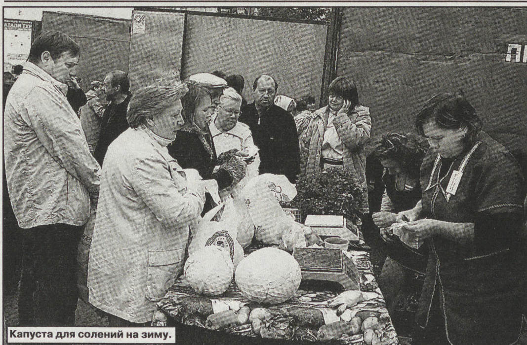
Капуста для солений на зиму.