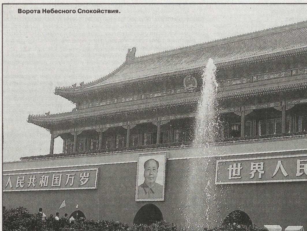
Ворота Небесного Спокойствия.

Есть прямо противоположные мнения: одни утверждают, что Великая Китайская стена — единственное творение человеческих рук, видимое с Луны. Другие говорят, что это выдумка, космонавты, мол, никакой стены не видели. На самом деле, какая разница. Мы-то это грандиозное сооружение, сотворённое руками миллионов людей, наблюда-