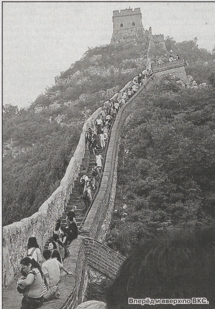
Вперёд и вверх по ВКС.

Туристам открыт не весь Запретный город (так что он продолжает быть запретным), поэтому что, по словам гида, «идёт реконструкция, а денег и реставраторов не хватает». Все здания сделаны из камня (стены) и де-