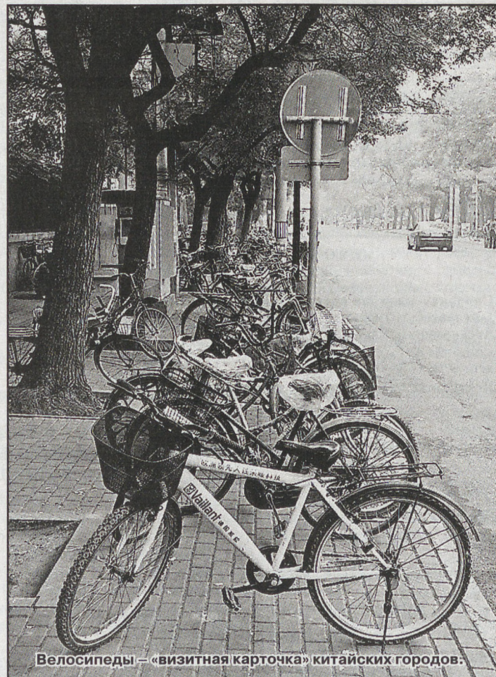
Велосипеды — «визитная карточка» китайских городов.