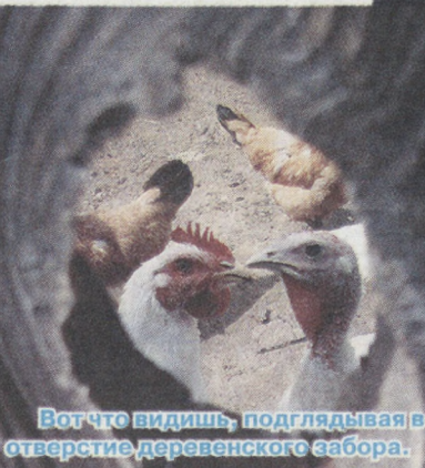
Вот что видишь, подглядывая в отверстие деревенского забора.