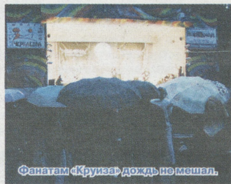
Фанатам «Крузи» дождь не мешал.

– По программе нам выделили всего полчаса, включая настройку, а у нас очень много сложного оборудования.