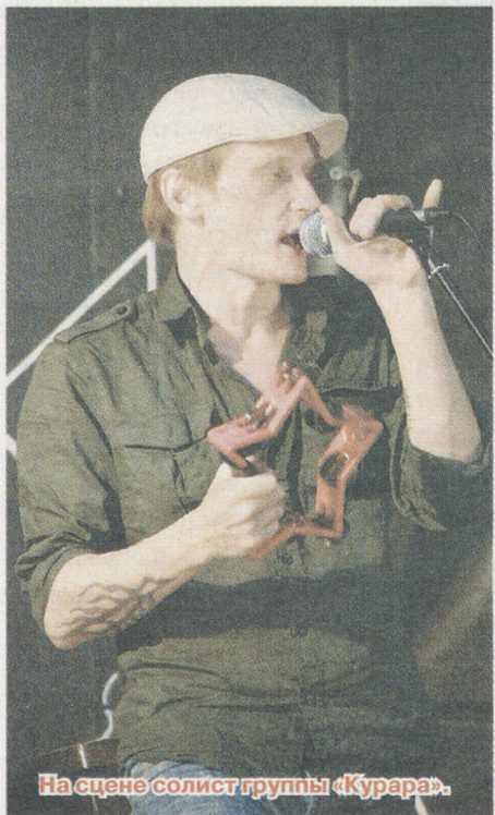
На сцене солист группы «Курара».

Не все зрители сразу влились в общую струю, некоторые решили расположиться в отдалении от сцены – заняли лавочки и лужайки. Чудаковатые поклонники рок-музыки шумели, прыгали и танцевали что-то наподобие кан-