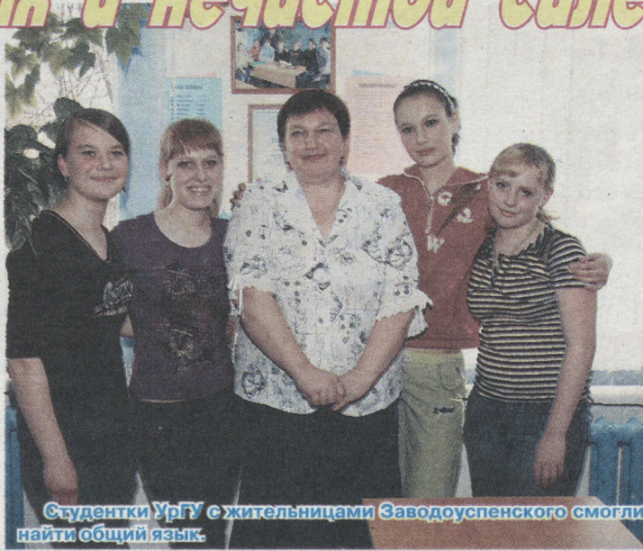
Студентки УрГУ с жительницами Заводоуспенского смогли найти общий язык.

Это только часть увлекательного материала, который собрал