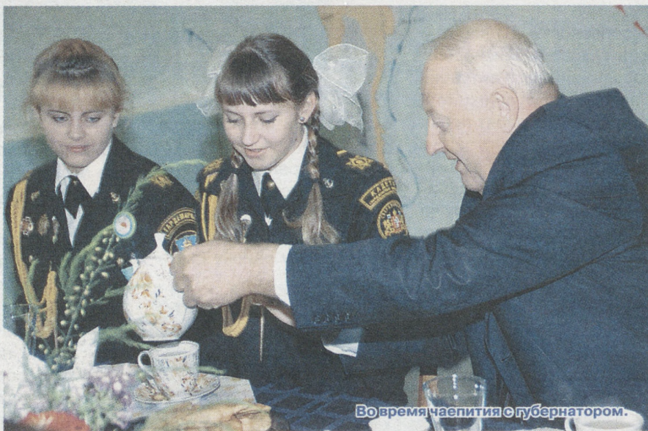
Во время чаепития с губернатором.

...Этот корабль, начавший плавание 10 лет назад, уверенно держится на волнах жизни: ученики достойно выступают на предметных олимпиадах всех