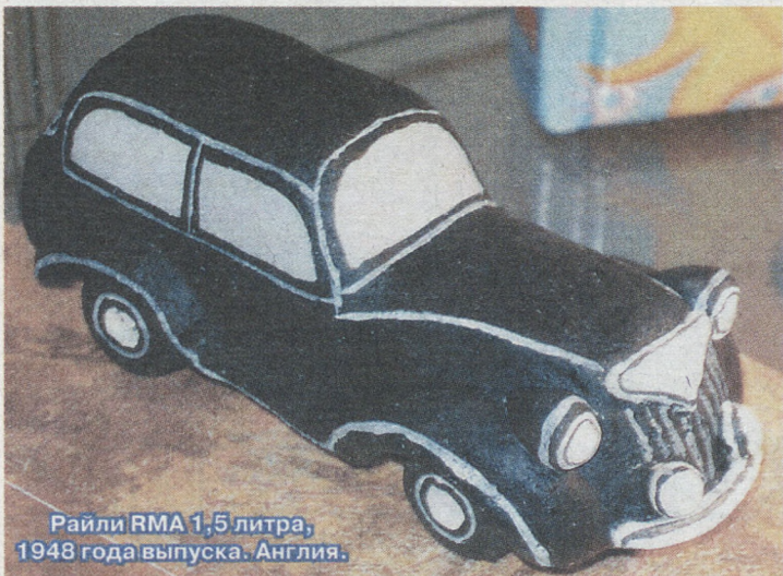
Райли RMA 1,5 литра, 1948 года выпуска. Англия.