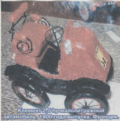
Клемент 2,5 л малолитражный автомобиль, 1900 года выпуска. Франция.