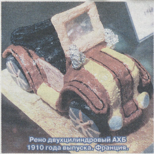
Рено двухцилиндровый АХБ 1910 года выпуска. Франция.