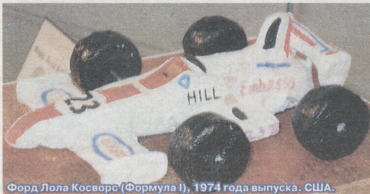
Форд Лола Косворс (Формула I), 1974 года выпуска. США.