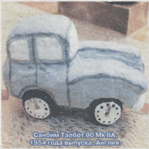
Санбим Тэлбот 90 Mk IIA, 1954 года выпуска. Англия.