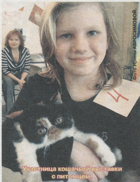
Участница кошачьей выставки с питомцем.

После мюзикла началась вторая, самая интересная, часть праздника – «Показ кошек», на который было приглашено 18 кошек. Хозяин вносил свою кошку в зал, сажал её на демонстрационный стол и рассказывал о ней: кличку, возраст, породу, интересные особенности. Потом кошек проносили мимо зрителей, чтобы они могли их лучше рассмотреть. Руки так и тянулись погладить