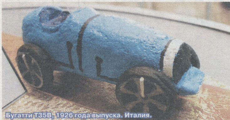
Бугатти Т35В, 1926 года выпуска. Италия.

«Здравствуйте, уважаемые создатели «Новой Эры»! Я учусь в седьмом классе Байкаловской школы. Ваша газета приходит мне с 2007 года. Мне очень нравится «Новая Эра» — цветные и красочные картинки, заманчивые заголовки, интересные и познавательные материалы, рассказы, сказки.