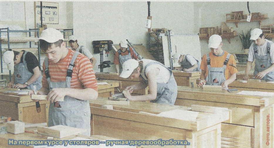
На первом курсе у столяров – ручная деревообработка.