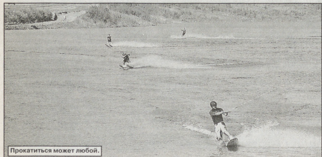
Прокатиться может любой.