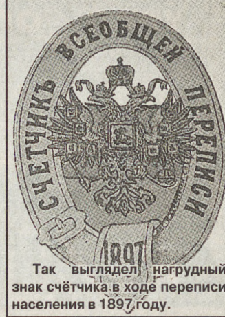
Так выглядел нагрудный знак счётчика в ходе переписи населения в 1897 году.

— Согласен, но страстные отношения героев развиваются в управлении статистики — на фоне скучной работы с циф-