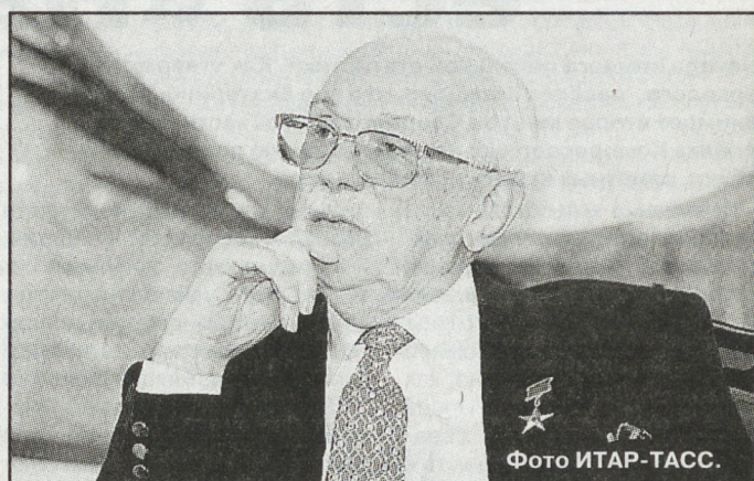
Выдающийся советский и российский поэт и писатель, автор советского и российского Гимнов Сергей Михалков скончался на 97-м году жизни.

Как сообщил ИТАР-ТАСС в семье покойного, «Сергей Владимирович Михалков скончался в одной из московских клиник». Сергей Владимирович родился 13 марта 1913 года в Москве. В 1933 году выпустил первый сборник стихов. Его стихи начали публиковать в журналах «Огонёк» и «Пролетар», в газетах «Комсомольская правда», «Известия», «Правда».