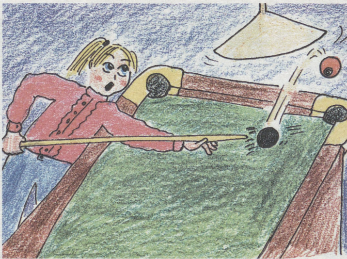
Рисунок Вероники КЛЕМЕНТЬЕВОЙ, 15 лет.

— Мои друзья. Когда я ездила на чемпионат Европы, все смотрели прямой эфир соревнований в Интернете, за меня болели. Тогда я заняла пятое место. Все очень расстроились. Но всё равно они верят в меня. Надеются на то, что в этом году я займу первое место.