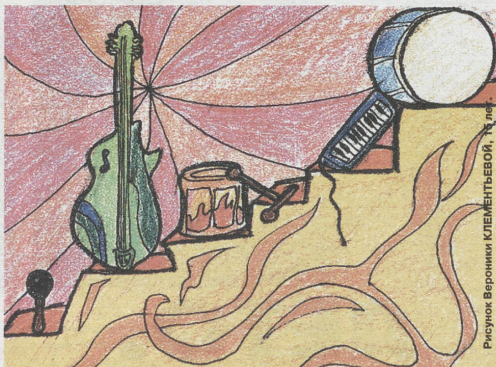
Рисунок Вероники КЛЕМЕНТЬЕВОЙ, 14 лет.

Курту Кобейну. Ещё мы играли 9 мая, на Дне молодёжи и Дне села. Сейчас пока нигде не выступаем, отрабатываем технику, копим новый репертуар.