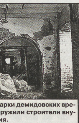
Такие арки демидовских времён обнаружили строители внутри здания.