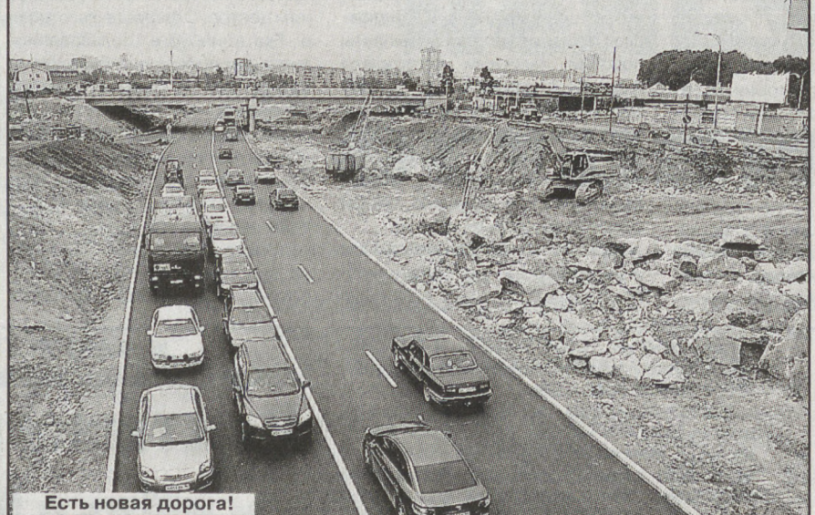
Есть новая дорога!