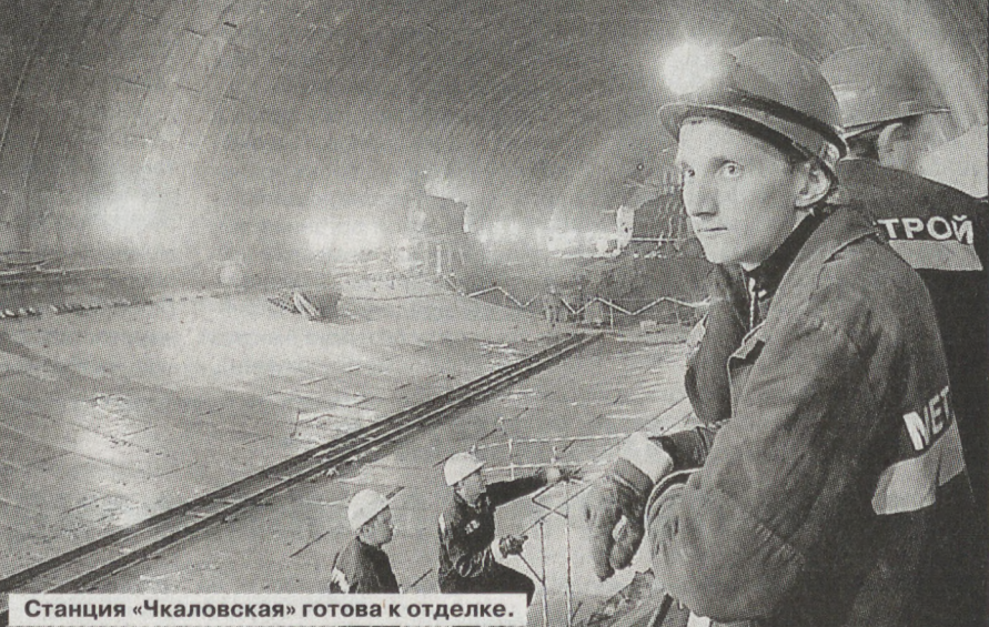
Станция «Чкаловская» готова к отделке.