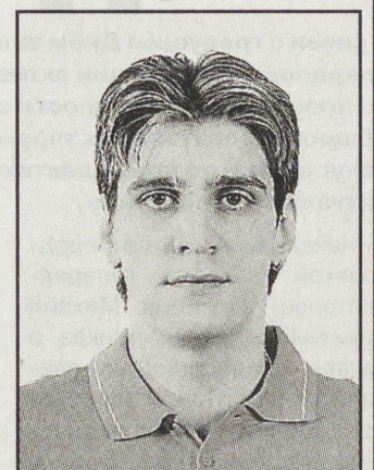
мира-2006, участник Олимпийских игр в Пекине.

С 2001 года (то есть с 18 лет) новичок «Локо» входит в состав сборной своей страны. Он бронзовый призёр чемпионата