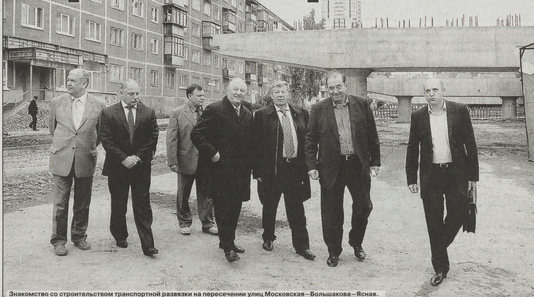
Знакомство со строительством транспортной развязки на пересечении улиц Московская — Большакова — Ясная.

Вчера губернатор Свердловской области Эдуард Россель осматривал строящиеся объекты транспортной инфраструктуры Екатеринбурга: дорожные развязки на пересечении улиц Серафимы Дерябиной — Гурзуфской — Репина, Московской — Большакова — Ясной, а также ознакомился с ходом строительства станций метро «Ботаническая» и «Чкаловская».