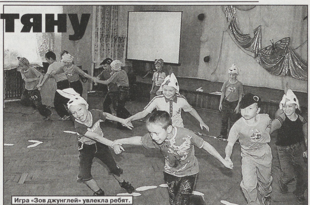
Игра «Зов джунглей» увлекла ребят.

— Мы предусматривали финансирование Уральского горнозаводского училища имени Демидовых. Кроме того, будут предприняты совместные усилия по реализации здесь целого ряда перспективных инвестиционных проектов. Строители, сотрудники УрГЗУ, каждый день ждут денег. Больше всего они беспокоятся, что отсутствие финансирования помешает началу отопительного сезона в городе. Но верят, что процесс сдвинется с места и через некоторое время в историческом центре города появится райский уголок, в котором маленькие «демидовцы» будут становиться большими, настоящими специалистами.