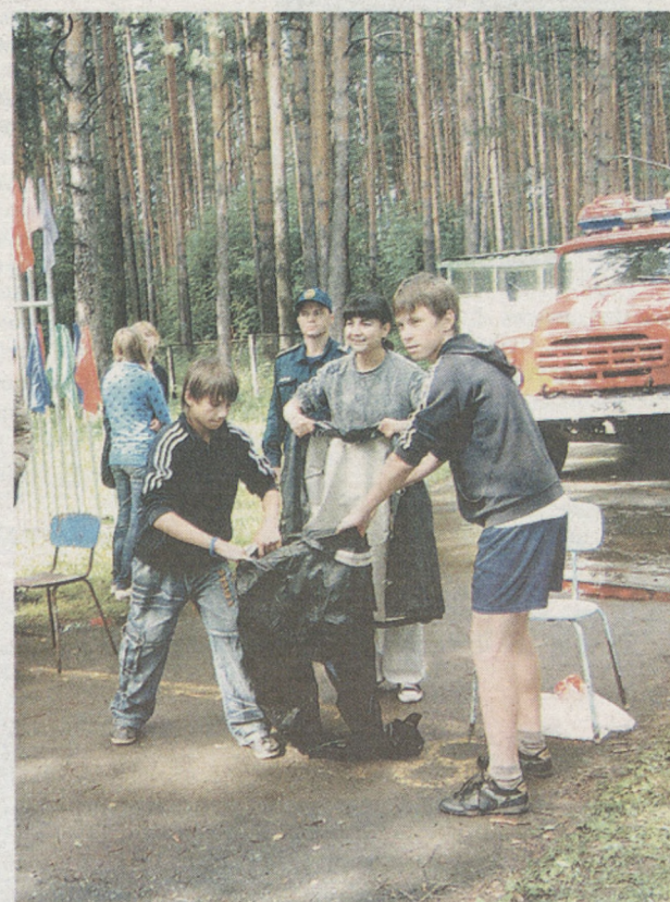
В костюме запрыгивай!