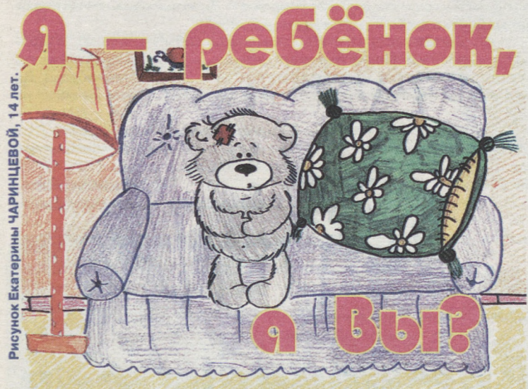
Рисунок Екатерины ЧАРИНЦЕВОЙ, 14 лет.

Роман ХУЖИН, 14 лет. г.Каменск-Уральский.