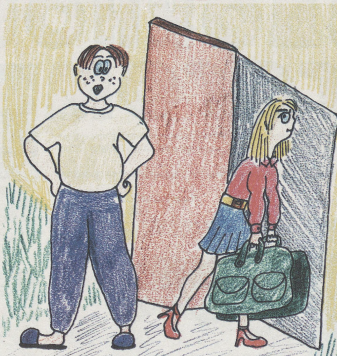
Рисунок Вероники КЛЕМЕНТЬЕВОЙ, 15 лет.

ствовать: «Как так! Такая хрупкая девушка тащит такие огромные сумки и даже некому помочь! Я бы, конечно, проводил тебя, но, извини, спина болит, да и вообще тороплюсь».