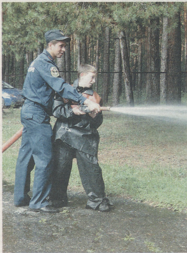
Одно из заданий эстафеты: попасть водой по цели.

«А что это за цифры?» — «Не знаешь, что ли, по «01» нужно звонить, когда пожар!». Двое парней с интересом разглядывают красную машину, которая стоит у ворот загородного оздоровительного лагеря «Рассветный», что в деревне Кадниково Сысертского городского округа. Сотрудники государственного пожарного надзора приехали провести для 270 ребят, отдыхающих в лагере, «День пожарной безопасности».