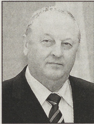
Эдуард Россель, комментируя это событие, отметил:

Эдуарду Росселю 18 августа был вручен Диплом министерства энергетики Российской Федерации, подписанный министром Сергеем Шматко, и благодарственное письмо оргкомитета «Специализированной выставки по энергосбережению и повышению энергоэффективности», которая прошла в рамках заседания Президиума Госсовета в Архангельске в начале июля этого года. Губернатору Свердловской области высказана глубокая признательность за оказанное содействие в обеспечении работы выставки.