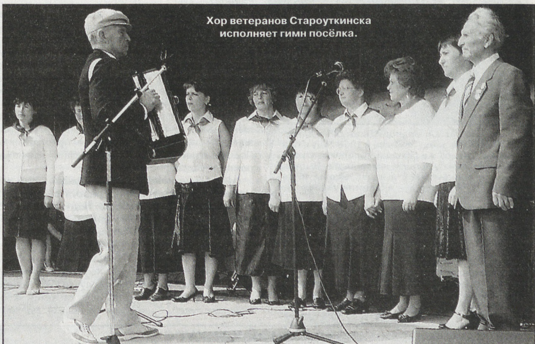
Хор ветеранов Староуткинского исполняет гимн посёлка.

Вера КАДУШИНА, посёлок Староуткинский.