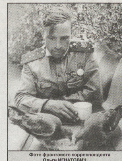
Фото фронтového корреспондента Ольги ИГНАТОВИЧ.

Поэтому мы вновь обращаемся к управляющим округами, министрам, депутатам Законодательного Собрания Свердловской области, главам городских округов и муниципальных районов, сельских поселений, руководителям предприятий, банков, организаций, фирм, компаний, учреждений и частным лицам с просьбой принять активное участие в благотворительной подписке и тем самым оказать посильную помощь ветеранам и инвалидам, малоимущим слоям населения, воинам-уральцам, советам ветеранов, госпиталю и больницам, школам... Время сейчас непростое. Сказывается