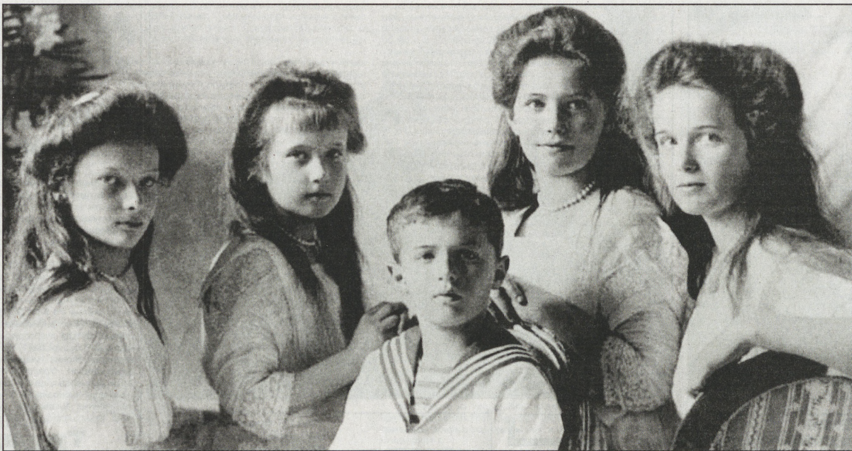
■ К 105-ЛЕТИЮ СО ДНЯ РОЖДЕНИЯ АЛЕКСЕЯ РОМАНОВА

Царица Александра целовала Алексея каждый раз, когда он подходил к ней, точно видя его в последний раз живым и прощаясь с ним. Он мог умереть от малейшего ушиба и чистого, порой месяцами, был прикован к постели. Один из приступов описан в письме к августейшей матери сиком Николем Вторым: "Бедняжка сильно страдал. Боли появлялись каждые четверть часа. Он почти не спал всё это время и не имел сил плакать и долго стонал, повторяя всё время одни и те же слова: "Господи, сжался надо мной!". Я с