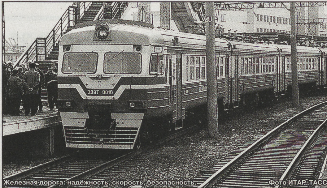
Железная дорога: надёжность, скорость, безопасность.

Обоснованные возражения принимаются в течение 30 дней с даты опубликования настоящего сообщения по адресу: 623330, Свердловская область, Тугулымский район, пос. Луговской, ул. Заводская, 1.