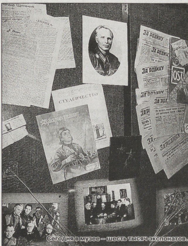
Сегодня в музее — шесть тысяч экспонатов.

ЛЕГКАЯ АТЛЕТИКА. На стадионе «Спутник» прошло командное первенство ОАО «Научно-производственная корпорация «Уральгазавода», в котором приняли участие 350 человек из 47 подразделений предприятия. Как и год назад, с большим преимуществом победили легкоатлеты «Уральского конструкторского бюро транспортного машиностроения» (УКБТМ), набравшие 4884 очка. На втором месте работники цеха №100 (3643 очка) и на третьем — представители отдела №940 (3314). По группам производств лучшими признаны металлурги цеха №630, механикостроители цеха №100, вагоностроители № 740, команды отдела №940 и УКБТМ.