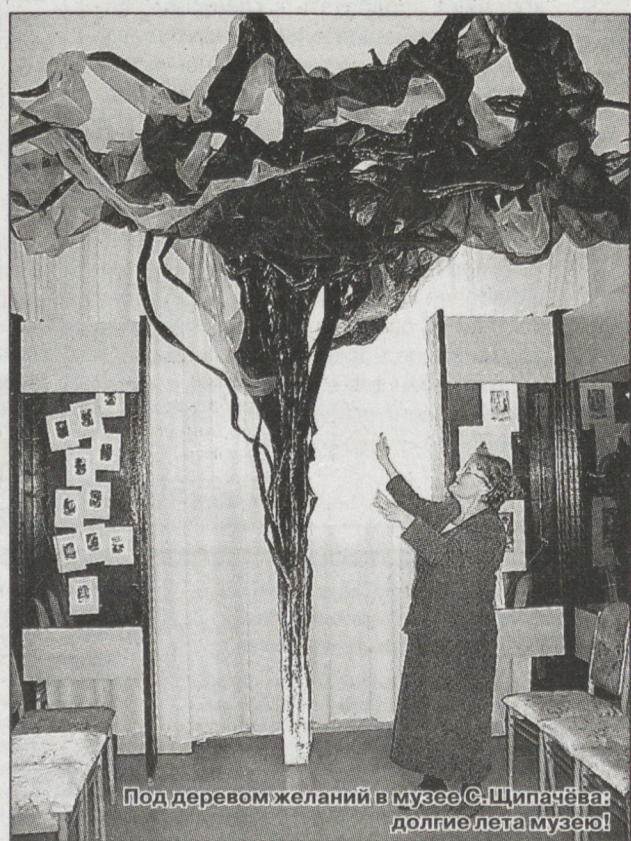
Под деревом желаний в музее С. Щипачёва — долгие лета музею!