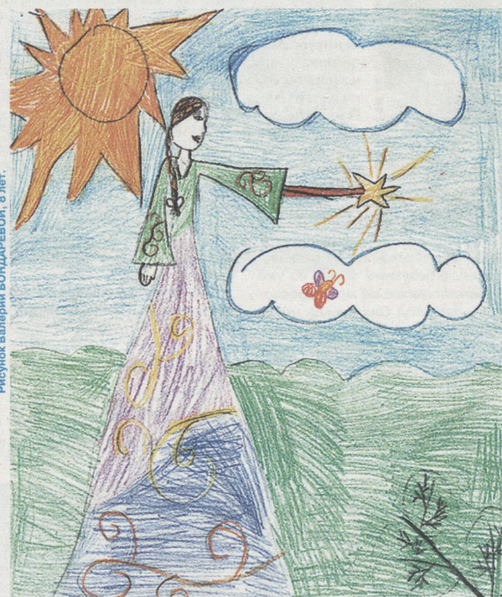
Рисунок Валерии БОНДАРЕВОЙ, 8 лет.

Жила-была одна девочка. Звали её Оленька.