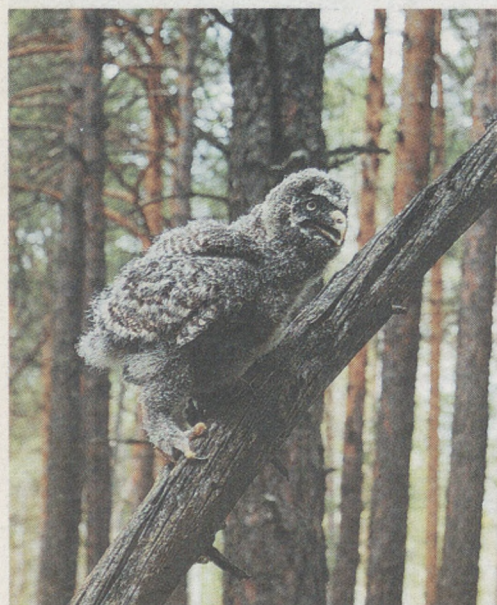
На дереве совёнок держался неуверенно.

схватил меня за руку, потащил за куст, потянул к земле и пробормотал на ухо: «Сиди тише!». Из-за деревьев показалась огромная сова. Мамаша летела на нас. Огромная голова, длинный хвост. Её крылья в размахе были метра полтора. Она летела медленно и бесшумно, издавая глухое и призывное «хуууу-ууу», изредка щёлкая клювом. Взглядом она искала ребёнка. Нашла. Успокоилась. Она взгромоздилась на дерево, соседнее с тем, куда я усадил птенца. Смотрела на него внимательно и грозно. А я смотрел на неё.