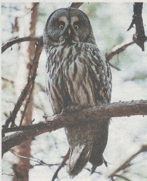
Мама-сова по сторонам смотрела грозно.

Когда я брал птенца на руки, он испуганно вертел головой. Разве я был