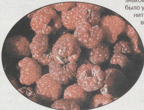
Не жизнь, а малина в посёлке Рефтинском.