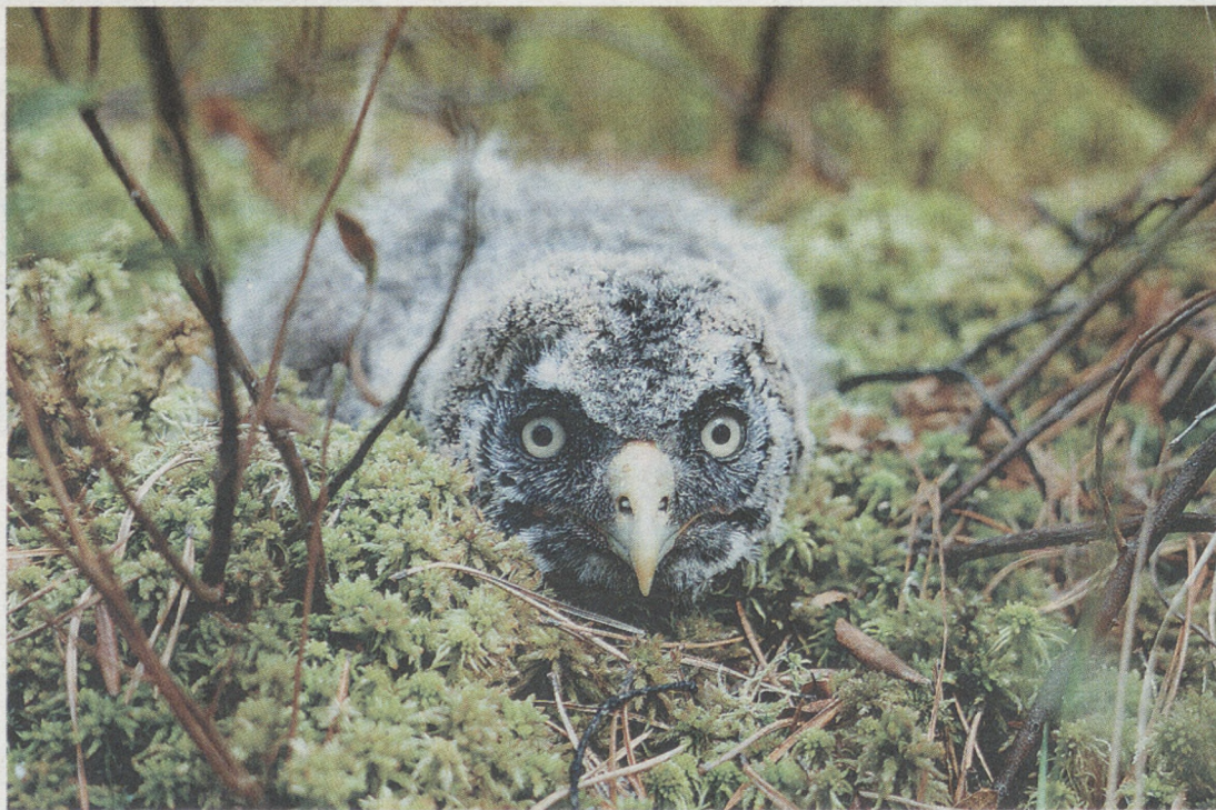
В траве совиный малыш напоминал неведомого зверька.

Пушистый серый комочек беспомощно барахтался. Я шагнул ему навстречу, поднял на руки и усадил на дерево. Дядя