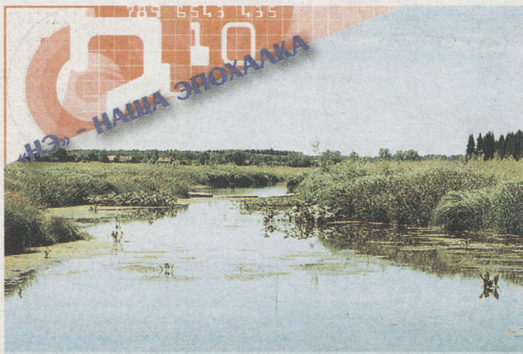
На подъезде к селу Азигулово Артинского городского округа. В таких болотах, наверное, живут водяные.