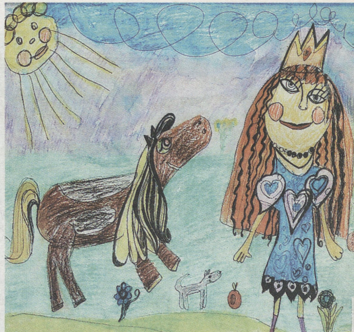
Участники конкурса оживляют сказку яркими красками.