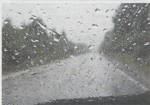
Дорога, дорога, ты знаешь так много... На пути в Карпинск.