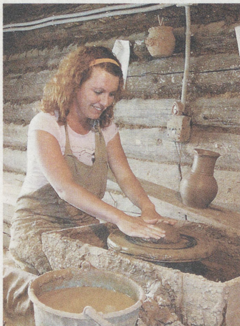
В селе Верхние Таволги Невьянского городского округа находится настоящий гончарный дом. Наш корреспондент Юлия Вишнякова не удержалась, чтобы не попробовать себя в роли гончара и «вляпаться» в настоящую глину.