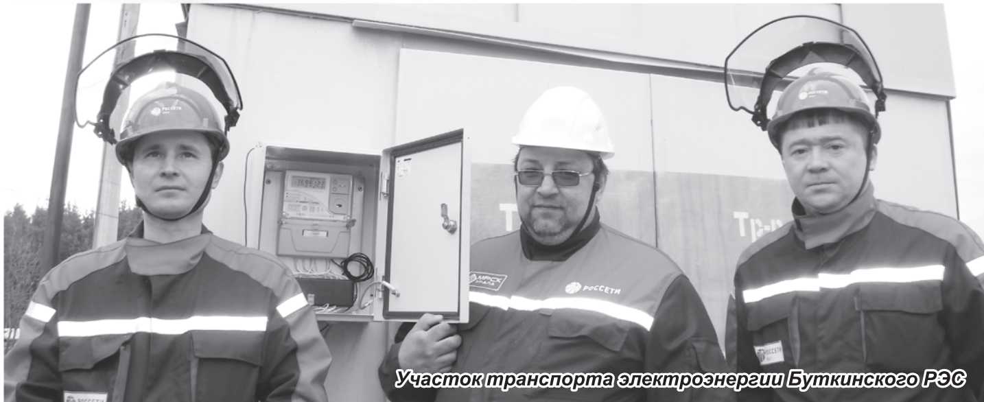
Участок транспорта электроэнергетики Буткинского РЭС

- На нашей улице недавно работали энергетики. Говорят, установили нам какие-то «умные» счетчики? Что это за новинки, зачем они нужны, и, самое главное, кто будет оплачивать эту установку?