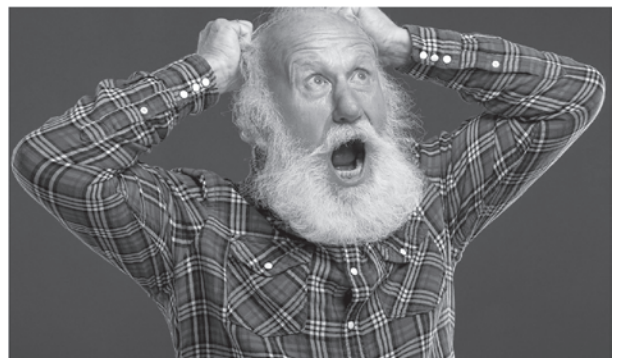
Подготовила Т. Белькова

Источником выплат должен стать федеральный бюджет. В 2022 году на эти цели может потребоваться 786,2 млрд. рублей.