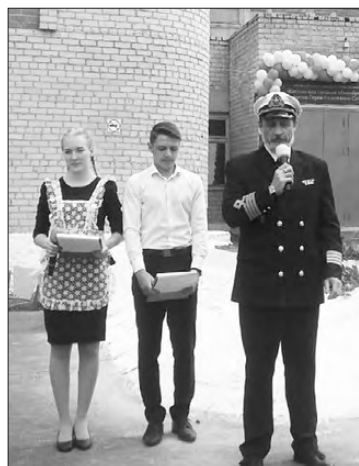
На линейке в честь присвоения школе имени Героя. 2019 г.