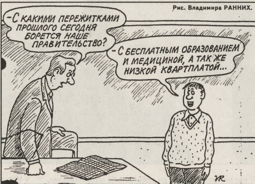
Рис. Владимира РАНИК.

Кстати, о заработной плате. В октябре прошлого года в Свердловской области средняя зарплата составляла 6241 рубль. В сфере образования — 3976 рублей, а в культуре и искусстве — 3398. И это при начислении районных коэффициентов! Если северяне имеют еще ряд льгот, то уральцы — один коэффициент, равный 15 процентам. При этом у нас тоже высоки