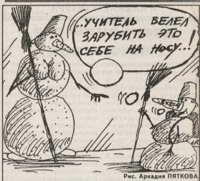
Рис. Аркадия ПЯТКОВА.

В предстоящие выходные дни и в начале следующей недели ожидается поступление на Урал холодного арктического воздуха, подует северо-западный ветер. Температура воздуха ночью понизится до минус 12... минус 17, в горах и пониженных частях рельефа до минус 25, днем до минус 10... минус 15 градусов, на дороге — гололедица.