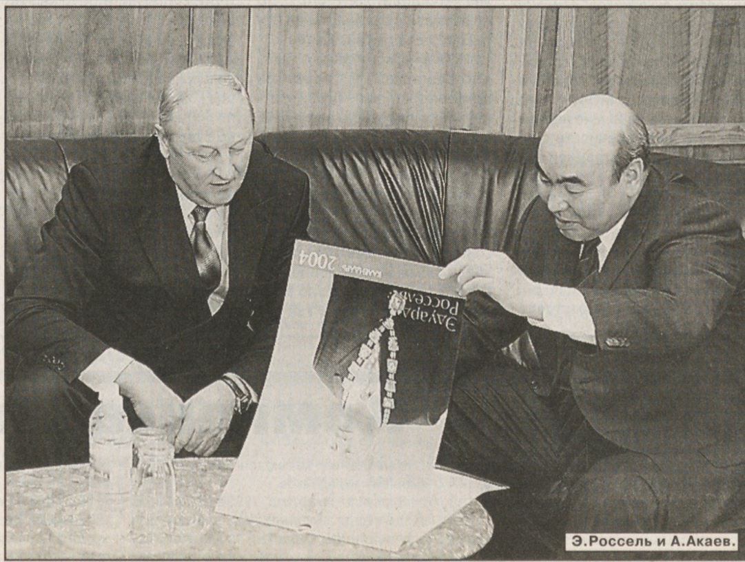
Э.Россель и А.Акаев.

Плодотворно прошла встреча свердловской делегации в министерстве сельского, водного хозяйства и перерабатывающей