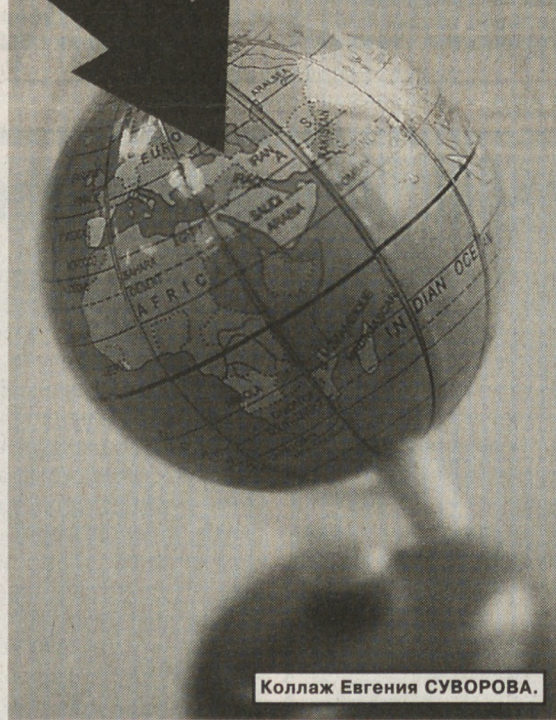
Коллаж Евгения СУВОРОВА.