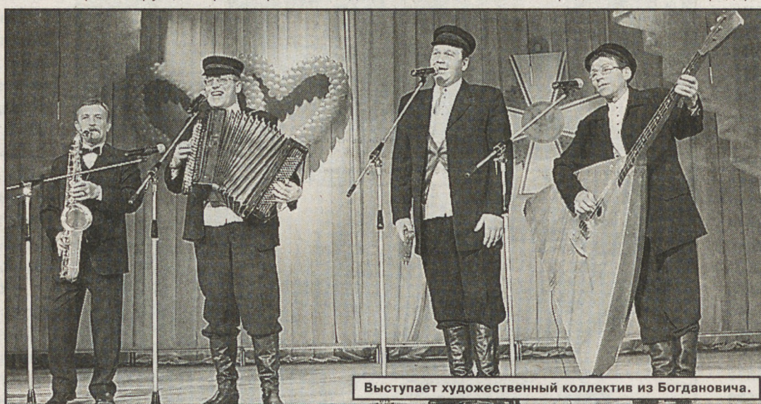
Выступает художественный коллектив из Богдановича.