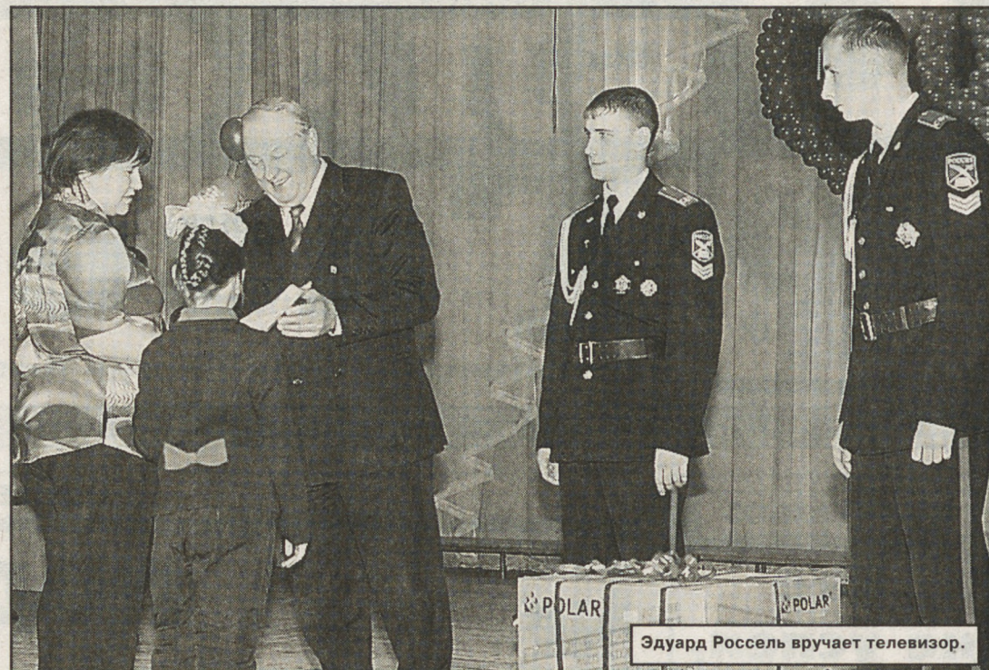
Эдуард Россель вручает телевизор.

ОАО "Екатеринбургский мукомольный завод" традиционно оказывает благотворительную помощь областному клиническому психоневрологическому госпиталю для ветеранов войн, спортивным организациям, детским домам. В 2003 году на оказание благотворительной помощи предприятие потратило 250 тыс. рублей.