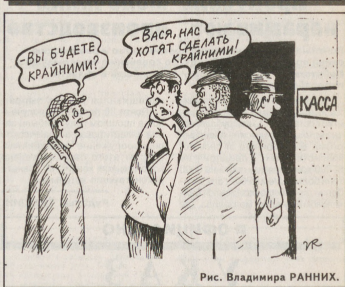
Рис. Владимира РАННИХ.

16 января влияние антициклона ослабевает, атмосферное давление воздуха будет слабо падать, но погода существенно не изменится. Осадки маловероятны, ветер юго-восточный, 5—10 м/сек. Температура воздуха ночью минус 11... минус 16, в горных районах до минус 21, днем минус 7... минус 12 градусов.