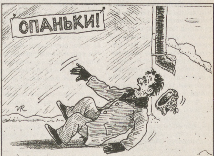
Рис. Владимира РАННИХ.