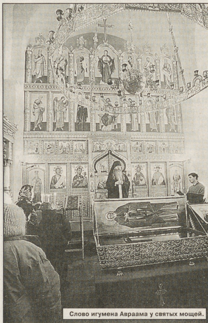
Слово игумена Авраама у святых мощей.

Среди духовных ценностей, которые возвращаются в российскую жизнь, можно назвать и уважение к людям высокого духа, которые в служении вере отказывались от всяких жизненных благ, становились примером подвижничества, бескорыстия, смирения.