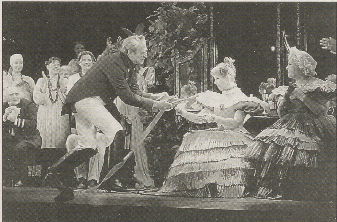
Сцена из спектакля «Женитьба».

— Да, хочется. И лучше бы так и было, чтобы ужасы остались для сцены, а в жизни мы обрели уверенность в завтрашнем дне и избавились от страхов.