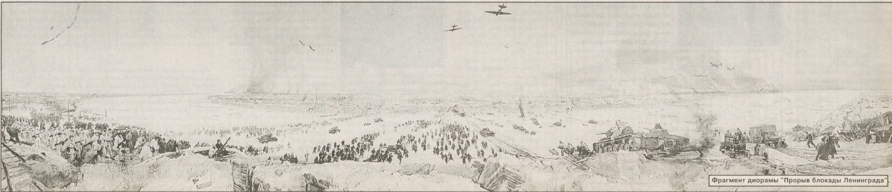
Фрагмент диорамы "Прорыв блокады Ленинграда"