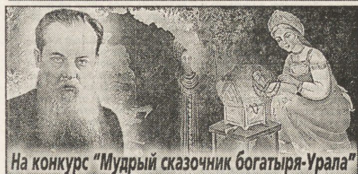
На конкурс "Мудрый сказочник богатыря-Урала"