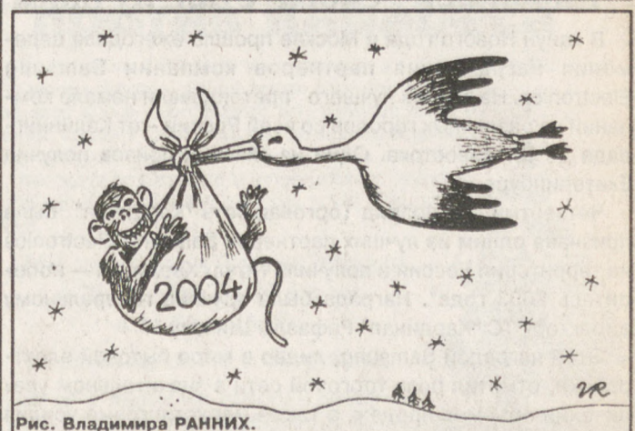
Рис. Владимира РАНИХ.