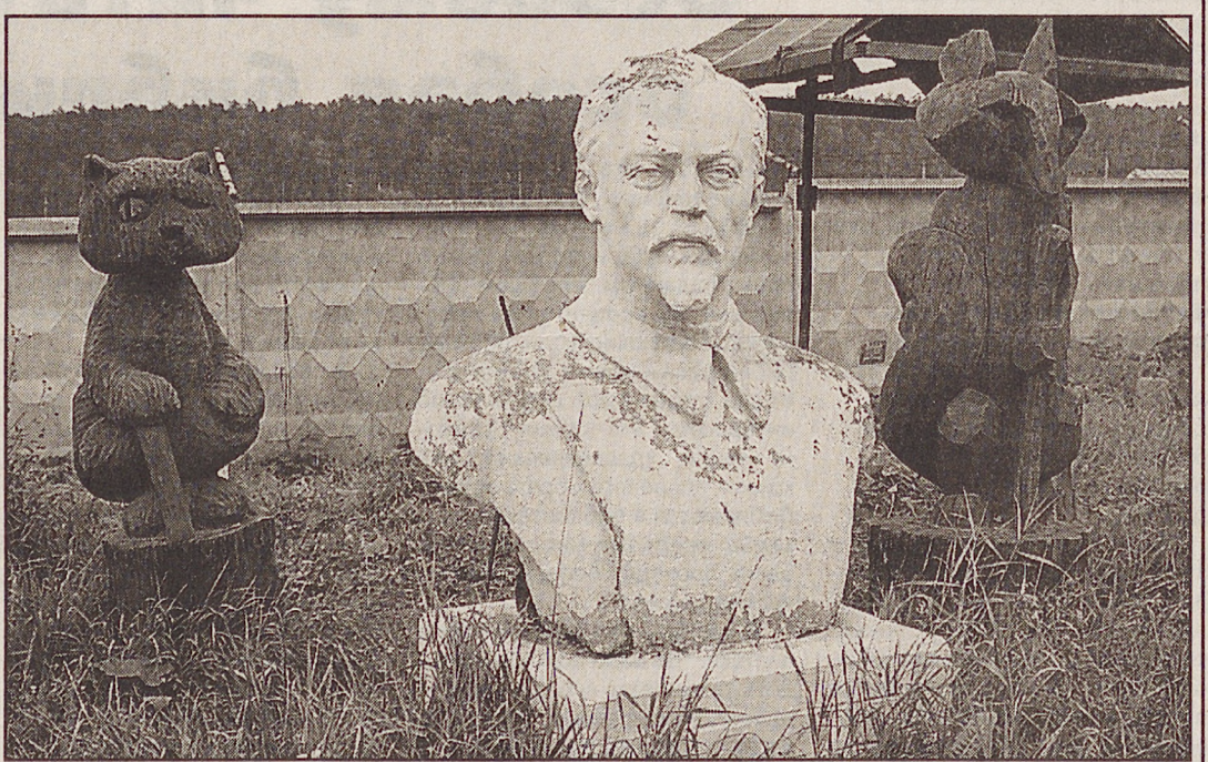
В истории, как в сказке: чем дальше, тем страшней...