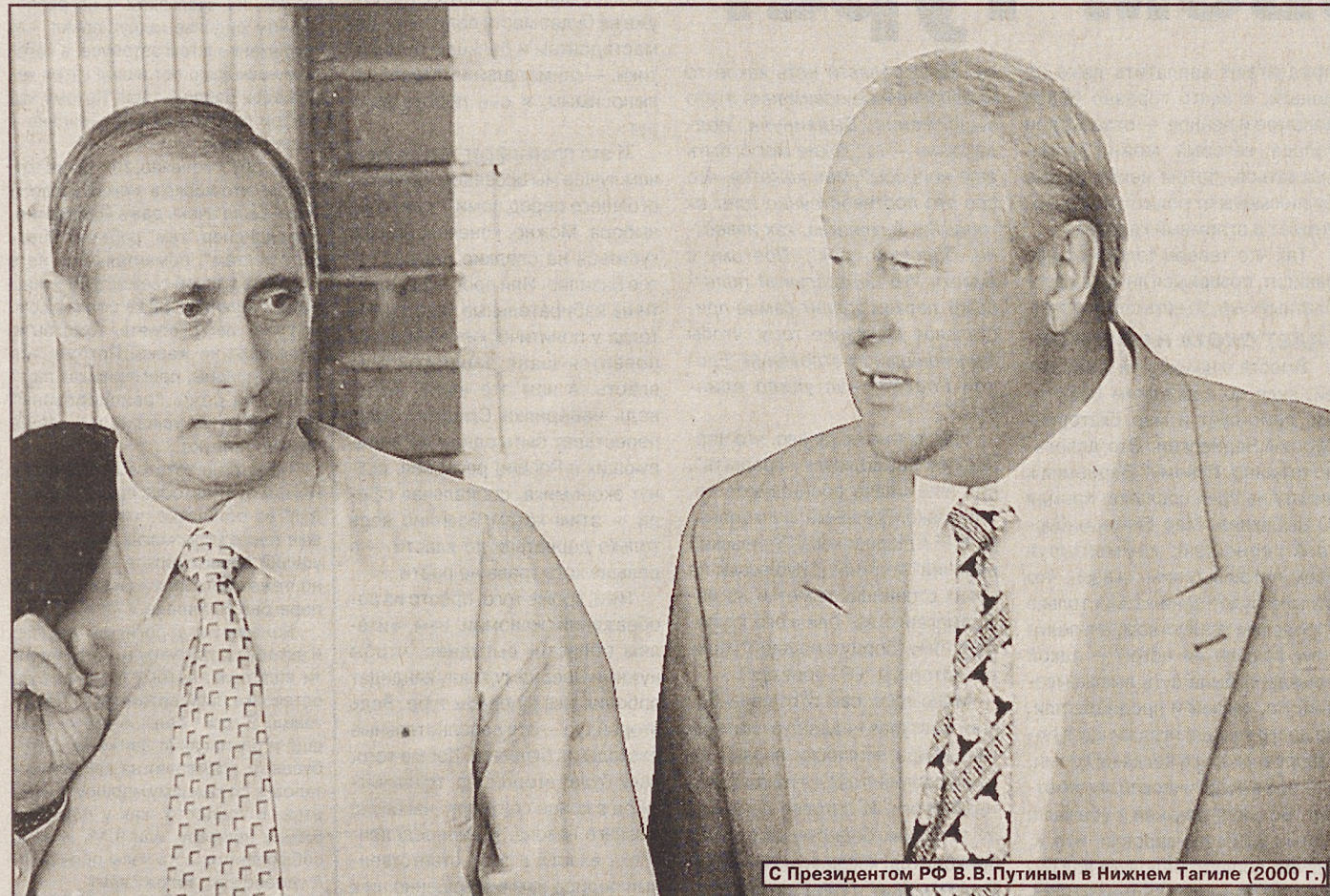
С Президентом РФ В.В.Путиным в Нижнем Тагиле (2000 г.)

Из выступления Президента РФ В.В.Путина на совещании в Тюмени в марте 2003 г. (Журнал «УрФО», № 2—3 за 2003 г.).