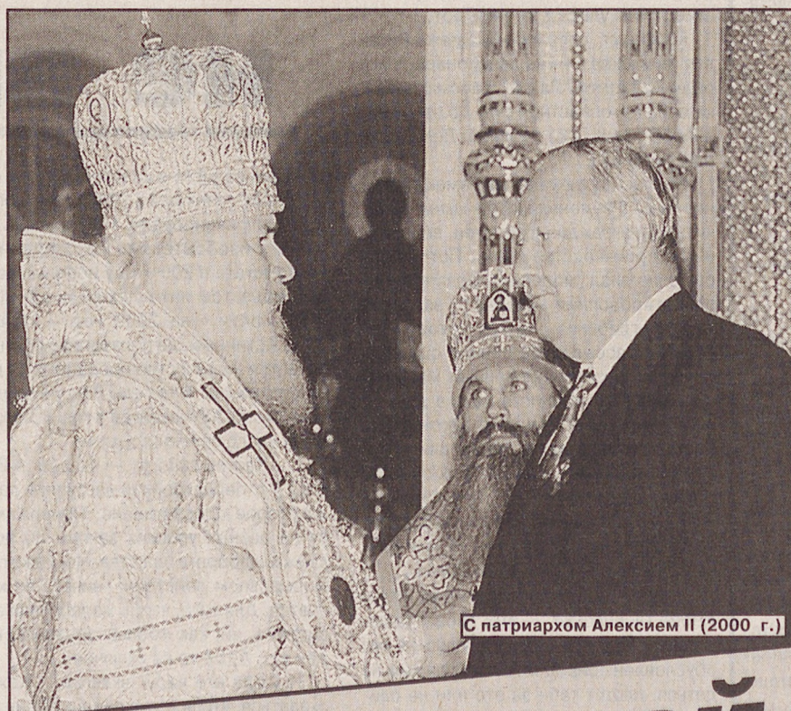
С патриархом Алексием II (2000 г.)

Мне нравится в Эдуарде Росселе доскональное знание проблем, громадное желание работать на благо Свердловской области. Это ощущает и директорский корпус. Россель постоянно заботится о предпринима-