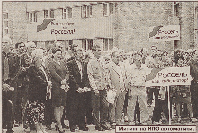
Митинг на НПО автоматики.