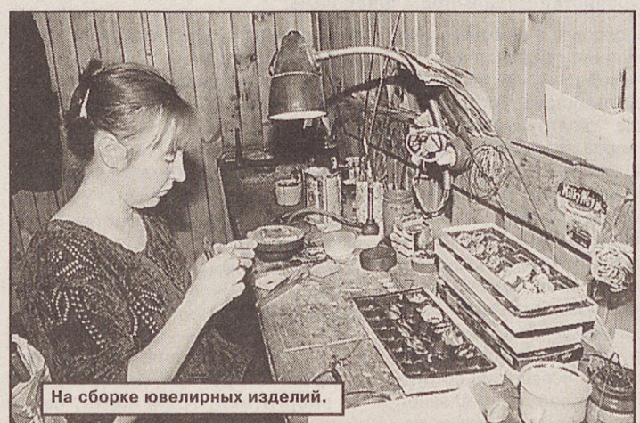
На сборке ювелирных изделий.

Бусы, ожерелья и другие изделия местных камнерезов демонстрируются на выставках и пользуются спросом в десятках регионов России. Тем не менее, финансово-экономическое положение предприятий крепким незовещь. Довольно велики затраты на энергоресурсы и сырье, серьезно укрепления требует материальная база, необходимы средства на улучшение условий труда мастеров, разработку новых изделий.