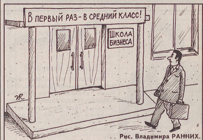
Рис. Владимира РАНИХИ.