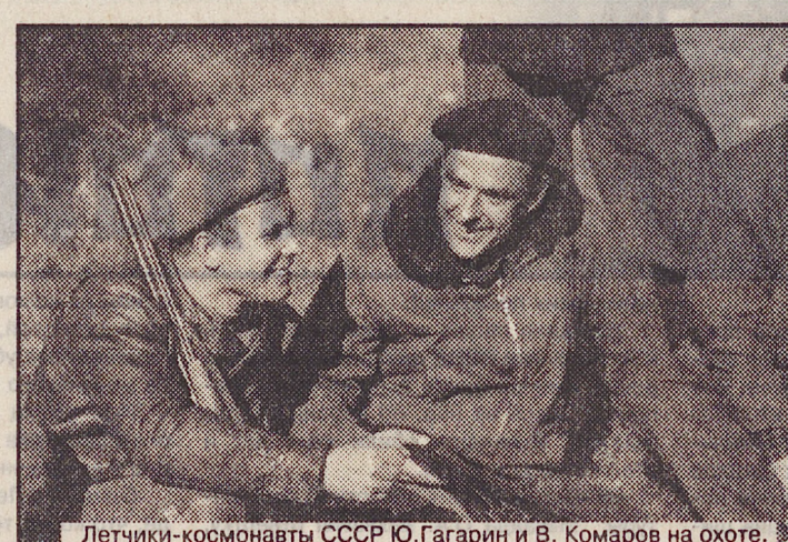
Летчики-космонавты СССР Ю. Гагарин и В. Комаров на охоте.

«Охота — приятное и полезное занятие, потому что приучает человека быть на природе... Я не вижу лучшего пути приобщения людей нашего индустриального общества к природе, как через охоту и рыболовство».