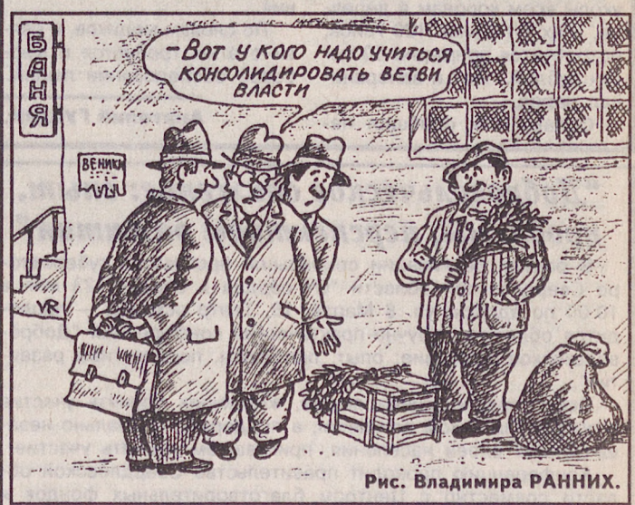
Рис. Владимира РАНИХ.

В ближайшие дни ожидается поступление арктического холода на Урал. Завтра по области сохранится облачная с прояснениями погода, осадки преимущественно в виде снега, ветер северо-западный 7–12, порывы до 15–18 м/сек. Температура воздуха ночью минус 2... плюс 3, на почве заморозки до минус 4, днем плюс 3... плюс 8 градусов.