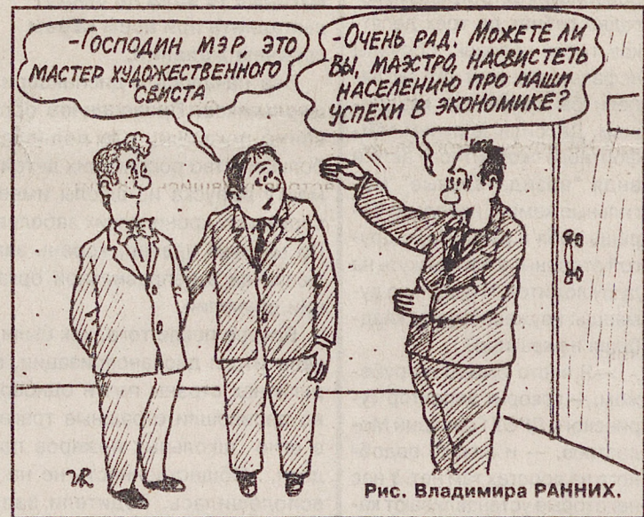
Рис. Владимира РАНИХ.

В Екатеринбурге ветхим бывает не только жилье, но и обещания главы города.