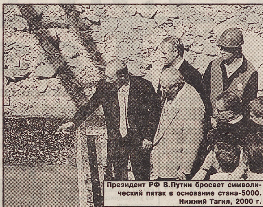
Президент РФ В.Путин бросает символический пятак в основание стана-5000. Нижний Тагил, 2000 г.

кой республики. Сейчас для нее страна, по мнению В.Путина, еще не созрела, и установление такой республики было бы опасным для России.