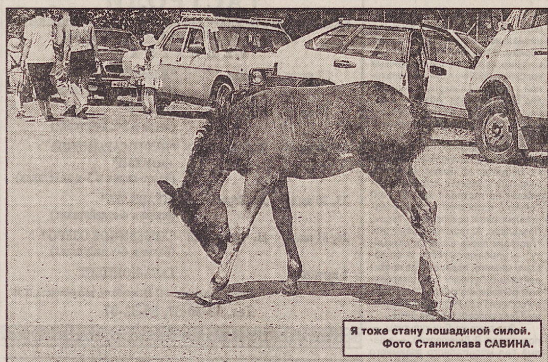
Я тоже стану лошадиной силой.