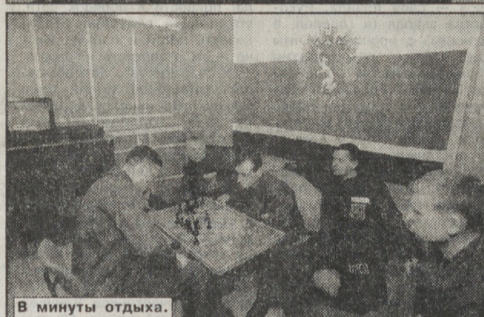
В минуты отдыха.

нелегко, если счет в катастрофах, как правило, идет на секунды. Быть у моря и не выйти в море невозможно. Старенький, как все вокруг, но еще очень крепкий и ухоженный буксир довез нас до край-