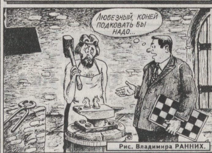
Рис. Владимира РАННИХ.

Погода 1–2 ноября по области ожидается переменная облачность, местами слабые осадки — преимущественно в виде дождя, на севере области — с мокрым снегом, ветер западный 3–8 м/сек. Температура воздуха 0... минус 5, на севере области до минус 11, днем 0... плюс 5, в горных районах и на севере области до минус 2 градусов.