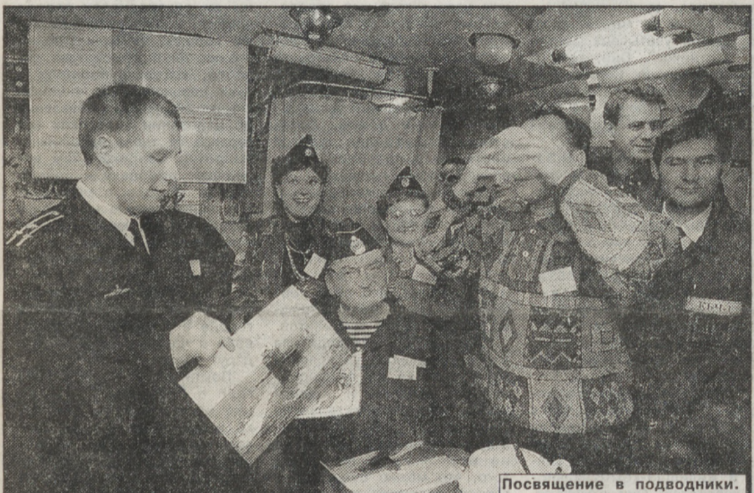
Посвящение в подводники.

не видно — со всех сторон серые скалы, а между ними темная вода. Понятие «скалистые горы» здесь становится совсем зримым, удивляя разнообразием оттенков одного и того же серого цвета. Северная природа — скупа на краски и звуки — к такой тишине уральцы не привыкли. Гаджиево, хотя и имеет статус города, по нашим меркам невелик — 18 тысяч жителей. Дома имеют сквозную нумерацию — от первого до 131-го. Больше двадцати зданий брошено — в суровом климате типовые пятиэтажки, построенные в 60-х годах, разваливаются быстрее, их даже не пытаются ремонтировать. В действительности проза жизни моряков производит более грустное впечатление, чем на экране телевизора. Для со-