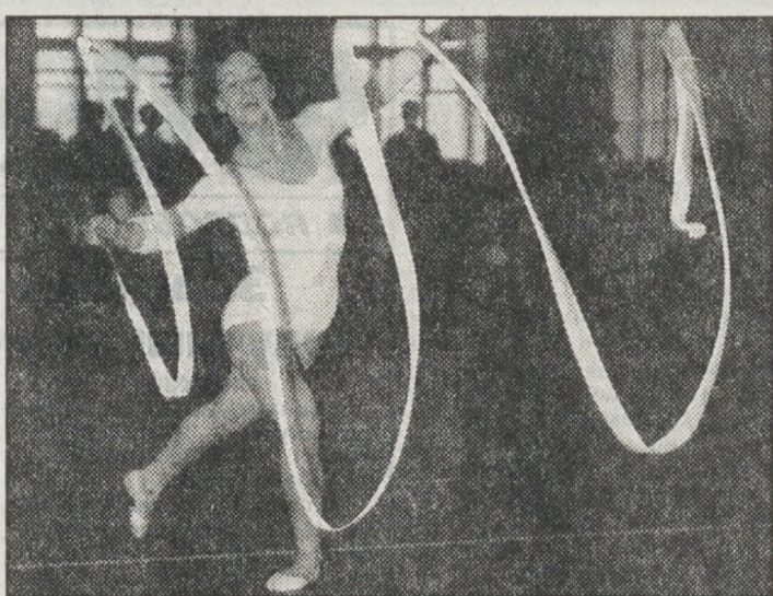
■ ЛЕГЕНДЫ СПОРТА