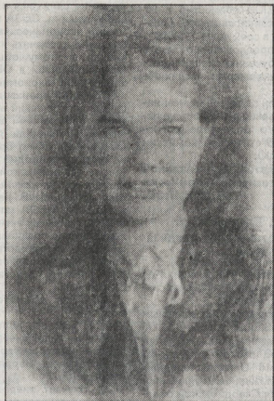
1947 год — это я, в том самом бархатном "кафтани", в котором отправилась в Москву.

тую два раза в году, я буду ездить в Москву, в Главтрубосталь, в Главснаб министерства, в Госплан СССР и решать сложные вопросы, связанные с обеспечением завода материалами и металлом.