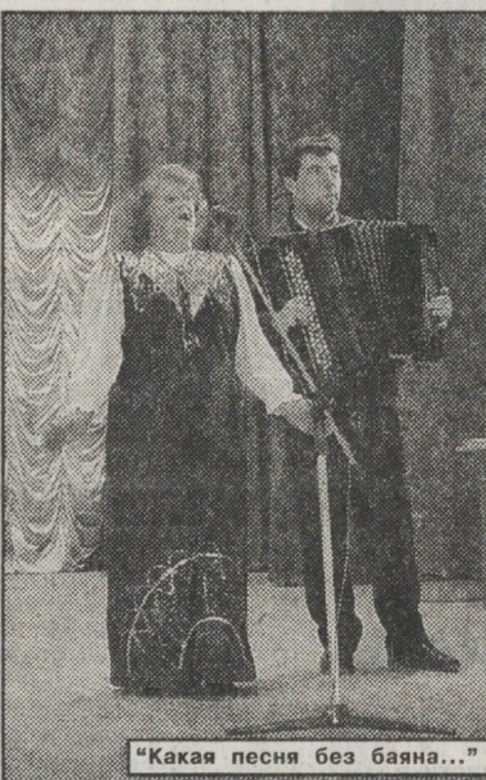
"Какая песня без баяна..."

да-то славно руководил заводом, нынче — "бытописатель" своего края, радующий за достойную жизнь земляков, а чтобы она в будущем стала и впрямь достойной, по заслугам и вложенному труду, написал, рассказы-