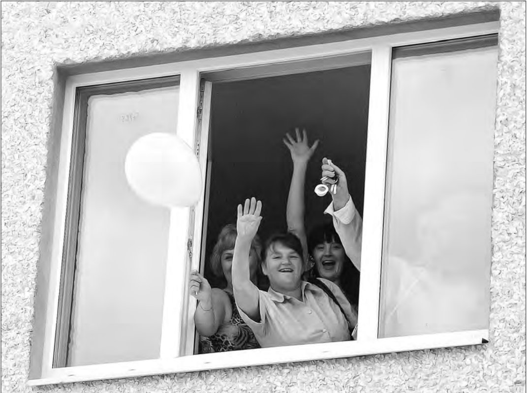
И на нашей улице Курортной праздник!