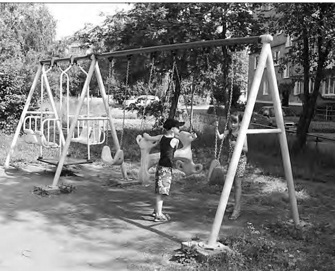
Во дворе дома №15 по ул. Известковой.

НОВИНКА: Правила противопожарного режима в Российской Федерации. Постановление Правительства РФ №390 от 25.04.12 г. Работаем за наличный и безналичный расчет. Адрес: 622001, г. Н. Тагил, ул. К. Маркса, 18. Магазин «Визит», тел.: (3435) 41-83-38, факс: 41-83-53