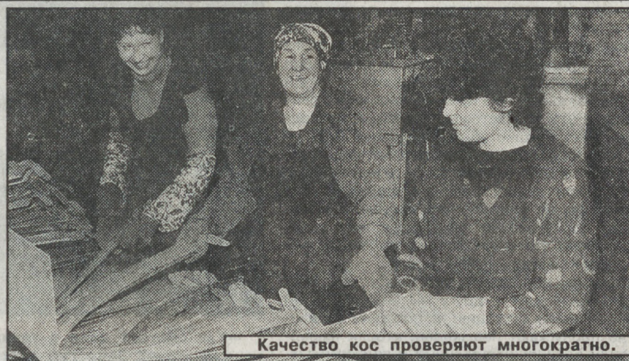
Косы проверяют многократно.

У нового, самостоятельного плавания много подводных камней, таких, о которых заводчане