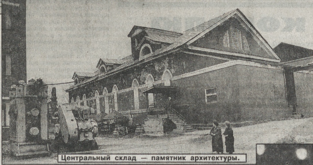
Центральный склад — памятник архитектуры.

Не проще дело и с иглой. Тем более, что в Артях выпускают великое множество разновидностей — швейные трикотажные, обувные, скорняжные и т.д. Вот около двухсот станков-автоматов деловито "пашут" одни, без людей. Но в конце пути, после сверлений, фрезеровок, заточек, закалок и т.д. иглы пройдут через женские руки. Каждая! Чтобы не стыдно по-