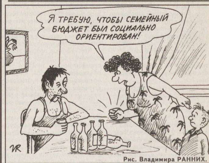
Рис. Владимира РАНИКА.

По данным Уралгидрометцентра, 25 декабря сохранится переменная облачность без осадков. Ветер юго-восточный, 2-7 м/сек. Температура воздуха ночью минус 15... минус 20, при прояснении до минус 28, днем минус 10... минус 15 градусов, на севере области — до минус 20 градусов. Морозная погода сохранится и в начале следующей недели, существенных осадков не ожидается.