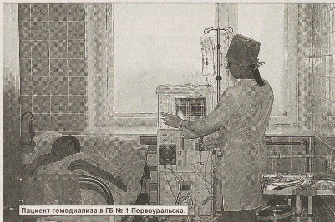
Пациент гемодиализа в ГБ № 1 Первоуральска.