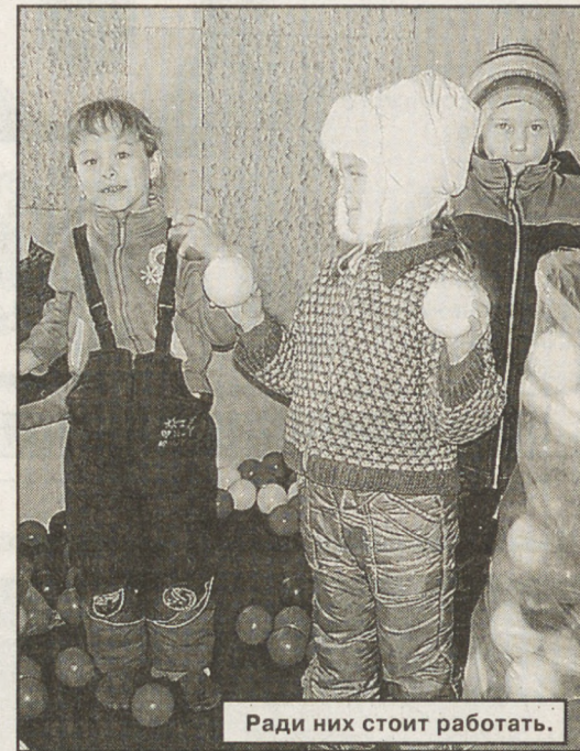
Ради них стоит работать.

Ирина КОТЛОВА, соб. корр. "ОГ".