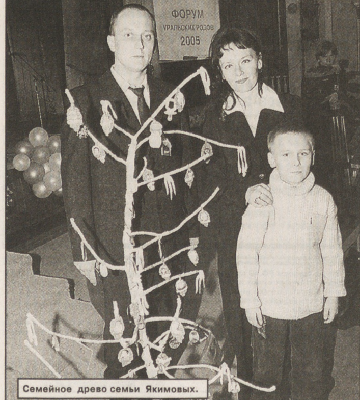
Семейное дерево семьи Якимовых.

На всероссийский фестиваль, где Климовы были лицом нашей области, приехали лучшие молодые семьи из Курска, Ростова, Удмуртии, Ленинградской и Кировской областей, Пермского