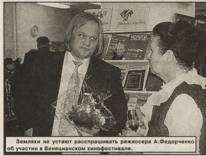
Земляки не устают спрашивать режиссера А.Федорченко об участии в Венецианском кинофестивале.

ХОККЕЙ. Первенство России. Дивизион "Восток": "Динамо-Энергия" — "Металлург" — 3:5. Подробнее — в следующем номере.