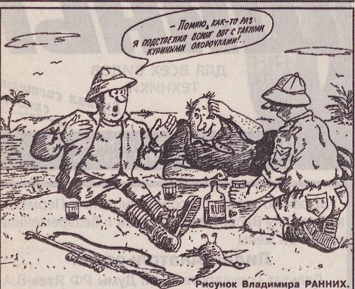
Рисунок Владимира РАННИХ.