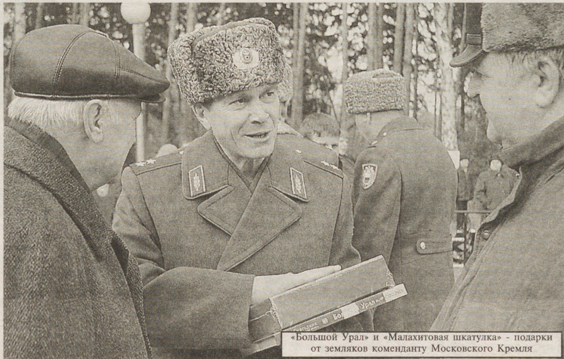
«Большой Урал» и «Малахитовая шкатулка» — подарки от земляков коменданту Московского Кремля

Праздник завершился. Завтра ребят ждет распределение, казармы, плац — служба. Мы от всей души поздравляем новоиспеченных кремлевцев и их родителей с почетной миссией, выпавшей на долю ребят. И от всего сердца желаем ребятам, как поется в песне: «Через две зимы, через две весны...» вернуться домой настоящими мужчинами, защитниками Отечества, профессионалами, на работе которых будет основываться достойное будущее и процветание Свердловской области и всей России.