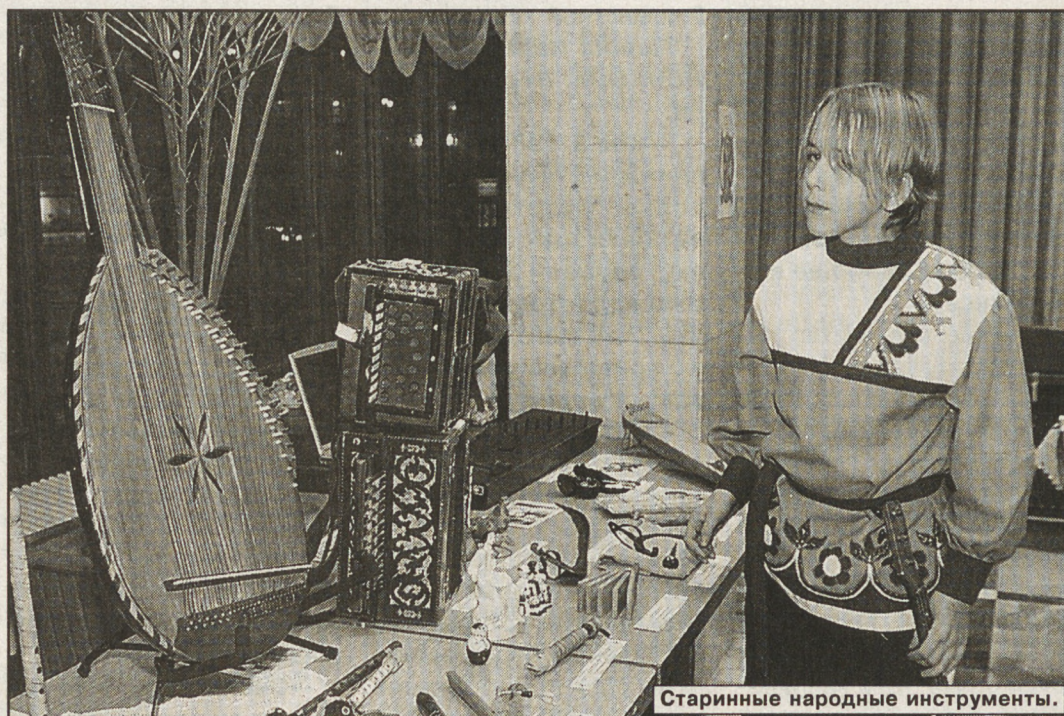
Старинные народные инструменты.