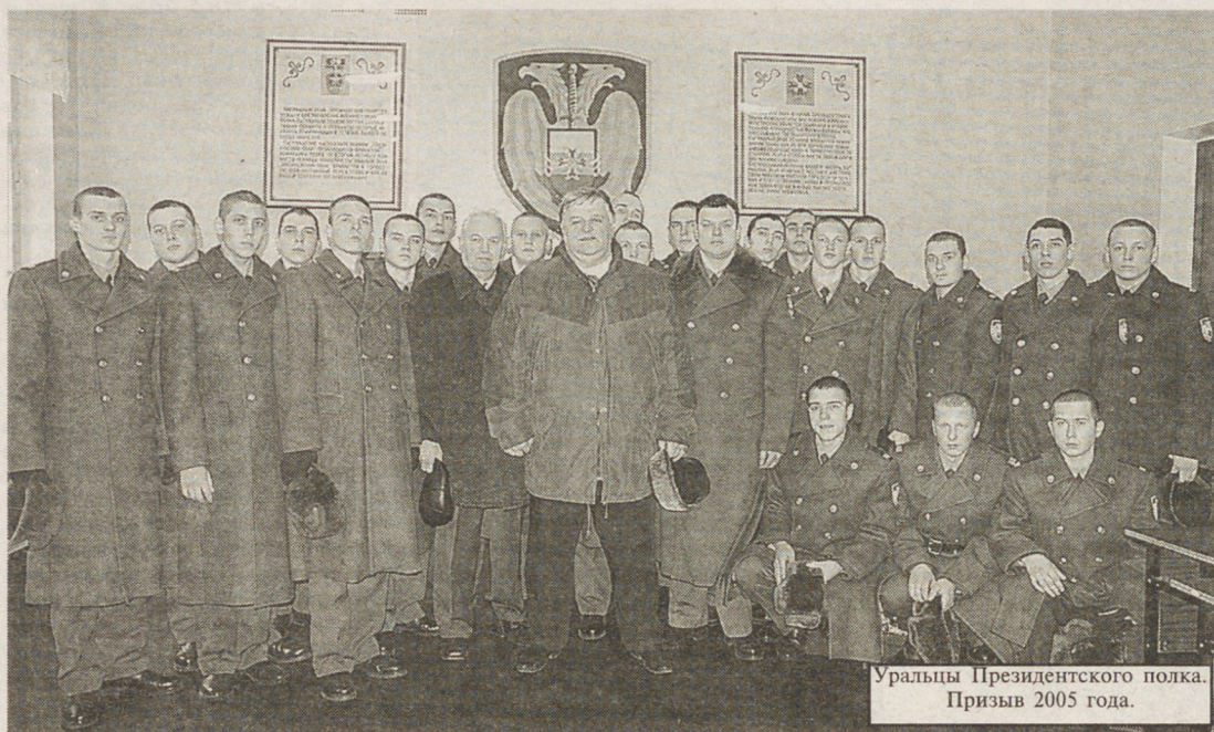
Уральцы Президентского полка. Призыв 2005 года.

Морозное московское утро 19 ноября стало особенно торжественным для двадцати пяти юных свердловчан. Они приехали в столицу двумя неделями раньше, чтобы подготовиться к важному событию в своей жизни — принятию воинской присяги. Вместе с ребятами приехали их родители, друзья, любимые. На лицах солдатских матерей не было той тревоги и боли — непереносимого атрибута сегодняшнего российского призыва. И это не удивительно. Их сыновьям повезло. Они будут нести службу в элитном подразделении — Президентском полку. Президентский (кремлевский) полк — уникальная воинская часть. Она решает специфические боевые задачи по обеспечению безопасности первых лиц государства и сохранности кремлевских ценностей. У кремлевского полка богатая история и славные воинские традиции. Датой рождения полка считается 8 апреля 1936 года, когда приказом №122 по гарнизону Московского Кремля Батальон особого назначения был реорганизован в Полк специального назначения. День части отмечается 7 мая. Ежегодно в этот день происходит представление Президентского полка Президенту России. Новобранцы еще не до конца осознали степень ответственности, которая ляжет на их плечи, но уже понимают — им выпала доля служить не просто в сердце России, а в самом центре ее жизнеобеспечения, предстоит охранять стабильность и спокойствие центра государственного управления.