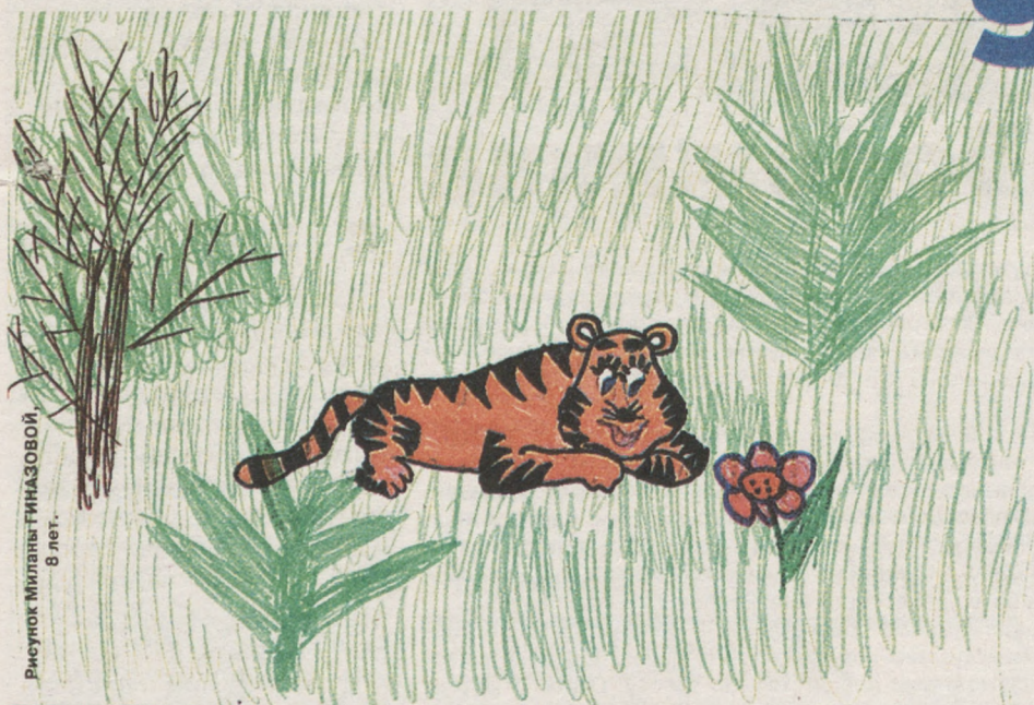
Рисунок Миланы ГИНАЗОВОЙ, 8 лет.