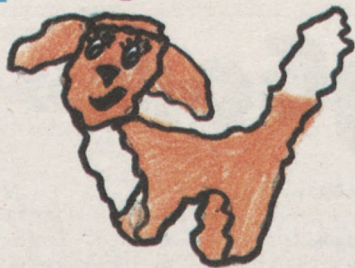
Рисунок Миланы ГИНАЗОВОЙ.