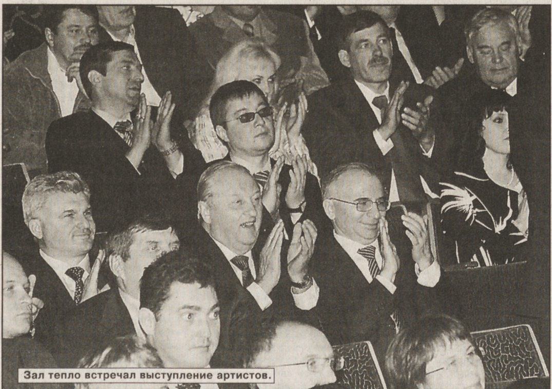
Зал тепло встречал выступление артистов.