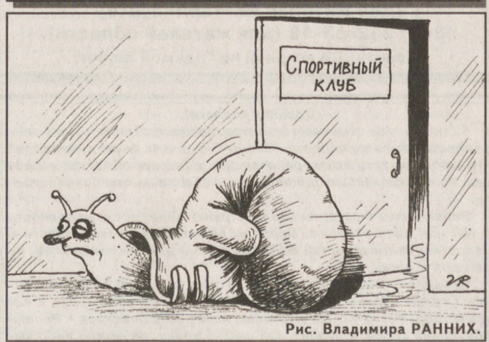
Рис. Владимира РАННИХ.

По данным Уралгидрометцентра, 13 ноября пройдет небольшой снег при слабом северо-западном ветре. Температура воздуха ночью минус 1... минус 6, на востоке области и в горных районах до минус 10, днем 0... минус 5 градусов. В начале новой недели будет преимущественно сухо и умеренно тепло: ночью чуть ниже 0, днем до плюс 3... плюс 4 градусов.