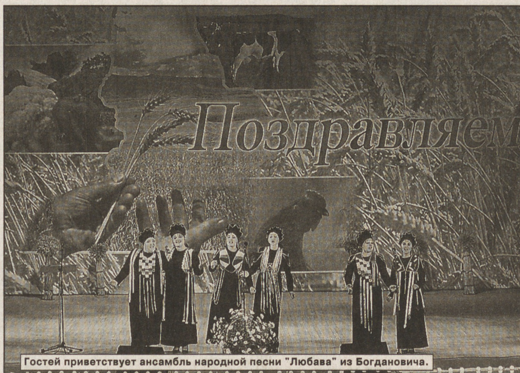
Гостей приветствует ансамбль народной песни «Любава» из Богдановича.

В Свердловской области поздравляли лучших тружеников села