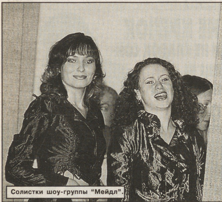
Солисты шоу-группы "Мейда"

Под таким девизом прошел I областной Молодежный форум национально-культурных объединений "Урал — территория молодых". Он был организован Свердловским региональным отделением Общероссийской общественной организации "Молодежное Единство" при поддержке департамента по делам молодежи правительства Свердловской области, Центром содействия национально-культурным объединениям при Уральском государственном горном университете.