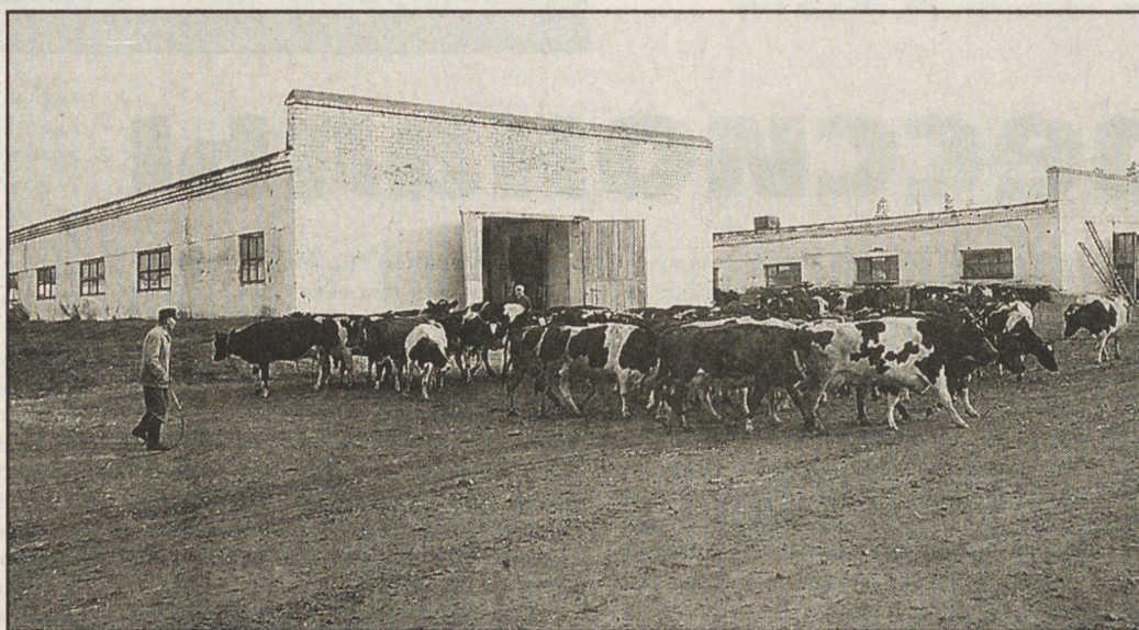
■ МОЛОДАЯ СМЕНА