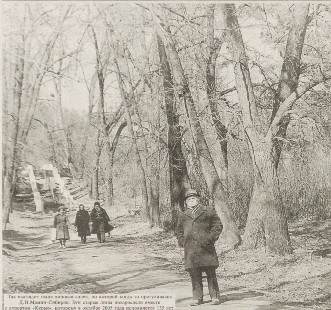
Так выглядит ныне липовая аллея, по которой когда-то прогуливался Д.Н.Мамин-Сибиряк. Эти старые липы повзрослели вместе с курортом «Курьи», которому в октябре 2005 года исполняется 135 лет.

ло известно, что здесь, в курзале, часто устраивались любительские спектакли, даже играл недурной оркестр.