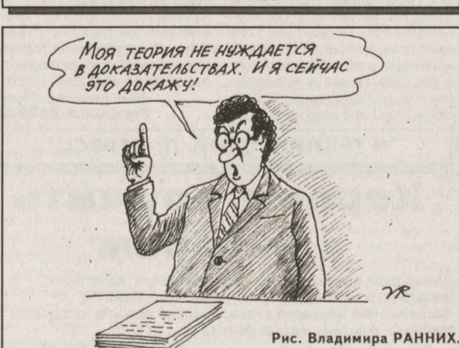
Рис. Владимира РАННИХ.

Погода По данным Уралгидрометцентра, 26 октября ожидается резкое ухудшение погоды, дожди перейдут в снег, в горных и северных районах возможно установление снежного покрова, гололедные явления. Ветер сменит направление с южного на северное. Резко похолодает: температура воздуха ночью будет еще плюс 1... плюс 6, но днем понизится до минус 3 градусов.