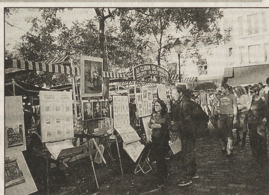
ФРАНЦИЯ ДВИЖЕНИЕ И ПОКОЙ НА СНИМКАХ: на одной из улиц Парижа; Монмартр; в Люксембургском саду; собор Сакре-Кёр.