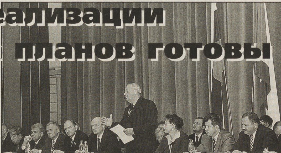
Выступает губернатор Э.Россель.

Деловой и конструктивной назвал деятельность правительства Свердловской области заместитель полномочного представителя Президента России в Уральском федеральном округе Сергей Вахруков. Именно с этих слов начал он свое выступление на заседании правительства, обсуждавшего вчера итоги социально-экономического развития области за 9 месяцев текущего года и задачи по реализации поручений Президента Российской Федерации Владимира Путина.