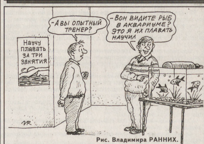
Рис. Владимира РАННИХ.