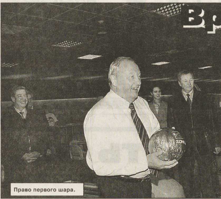
(Окончание. Начало на 1-й стр.).

Логика развития оптовых предприятий приводит к появлению логистических целей — товародвижения в традиционном понимании, но с новыми складскими технологиями. Нам нужен и опт (связь между городами и районами), и логистика, когда мы говорим о торгово-транспортном коридоре, который должен пройти через область. Его создание — это новые рабочие места, налоги, ос-