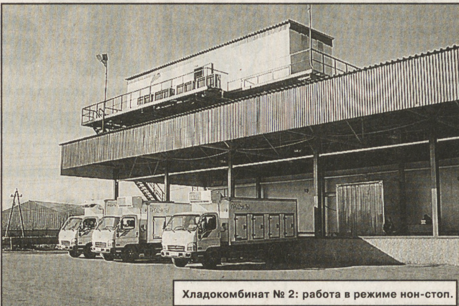
Хладокомбинат № 2: работа в режиме нон-стоп.

— У нас 600 тысяч квадратных метров складских помещений в городе и столько же еще не хватает. И уровень предприятий не всегда таков, как мы увидели сегодня. Если мы хотим стать крупным логистическим центром — перевалочным, комплектующим, определяющим пути доставки продукта до любого конечного назначения и потребителя, надо здесь иметь высокотехнологичные центры, которые все это сделают с наименьшими затратами. Надо подтянуть до высокого уровня остальные и формировать строительство новых помещений. Цели амбициозны. Ниша логистическая пока полупустая, и у нас есть все