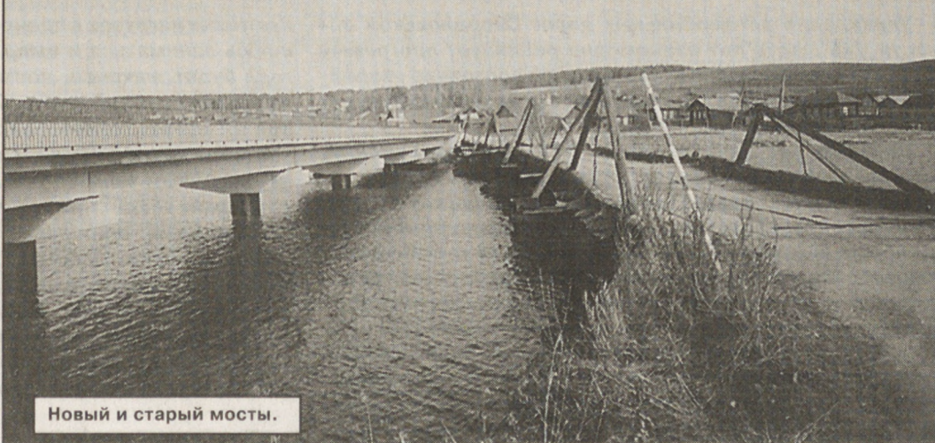
Новый и старый мосты.