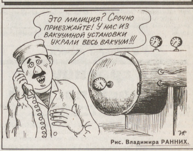
Рис. Владимира РАННИХ.

Погода По данным Уралгидрометцентра, 8 октяб-ря ожидается холодная погода с кратковре-менными дождями. В горах и на севере об-ласти не исключены осадки в виде мокрого снега. Ветер северный, 6-11 м/сек. Темпера-тура воздуха ночью минус 2...-, плюс 3, днем плюс 2...-, плюс 7 градусов.