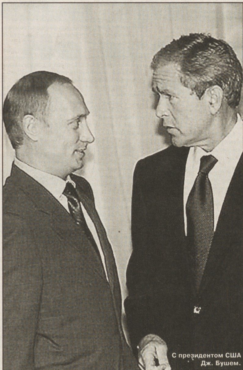
С президентом США Дж. Бушем.