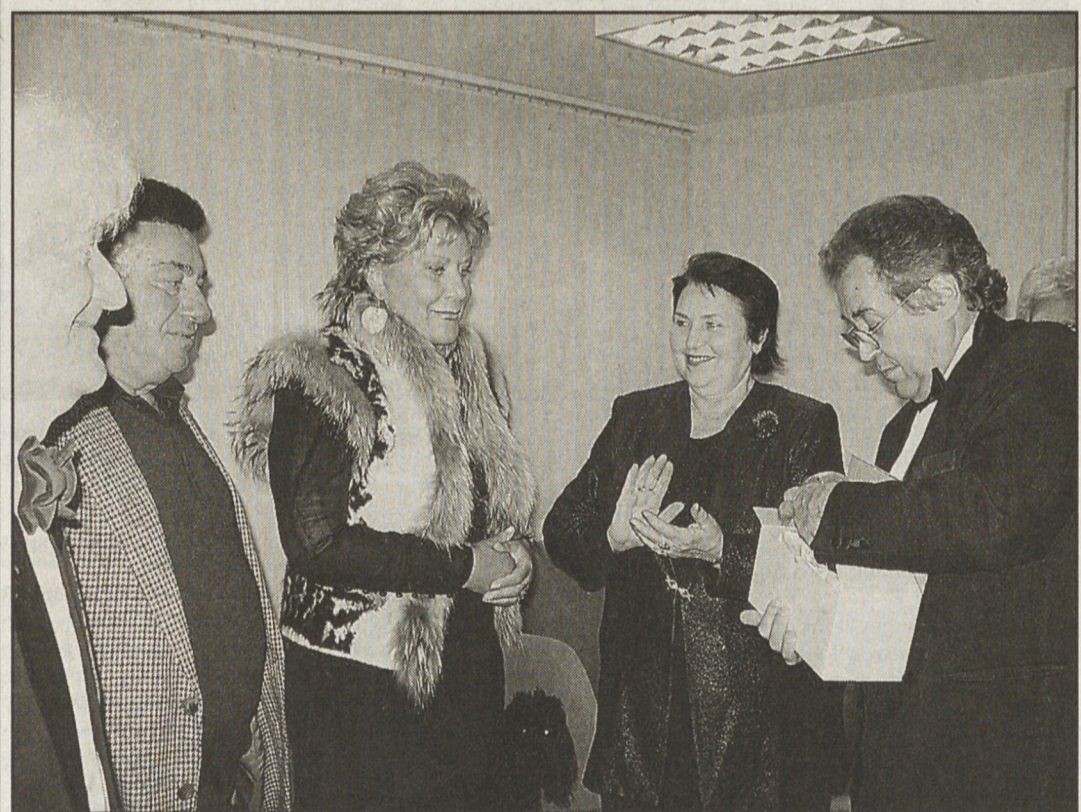
В одном из ближайших номеров «ОГ» читайте интервью с Е.Образцовой.

По 12 октября «ВЫСШИЙ ПИЛОТАЖ» «Юго-Западный», «Космос» «Знамя» с 13 октября