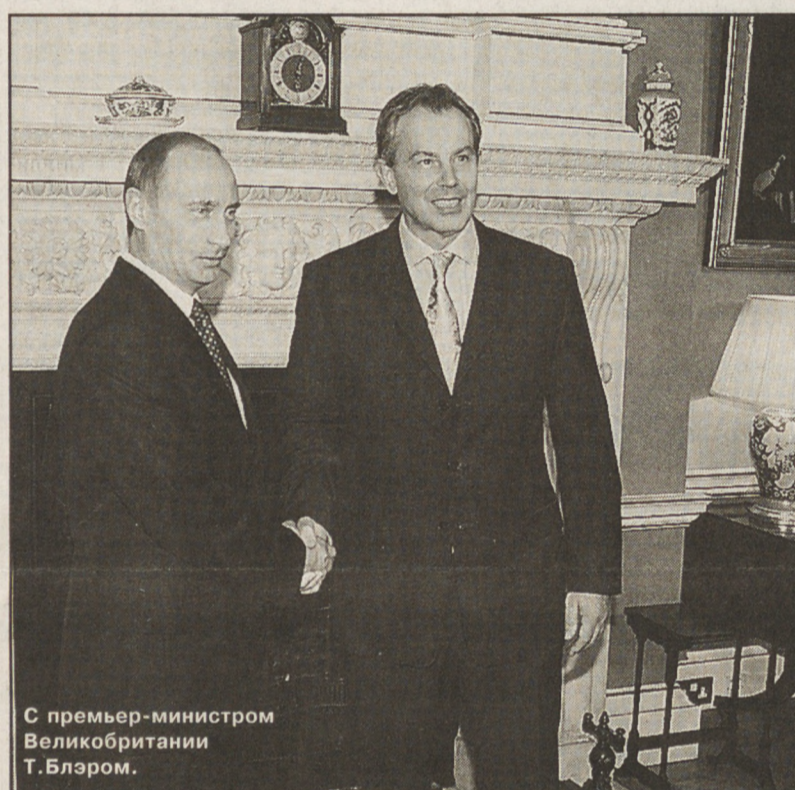
С премьер-министром Великобритании Т.Блэром.