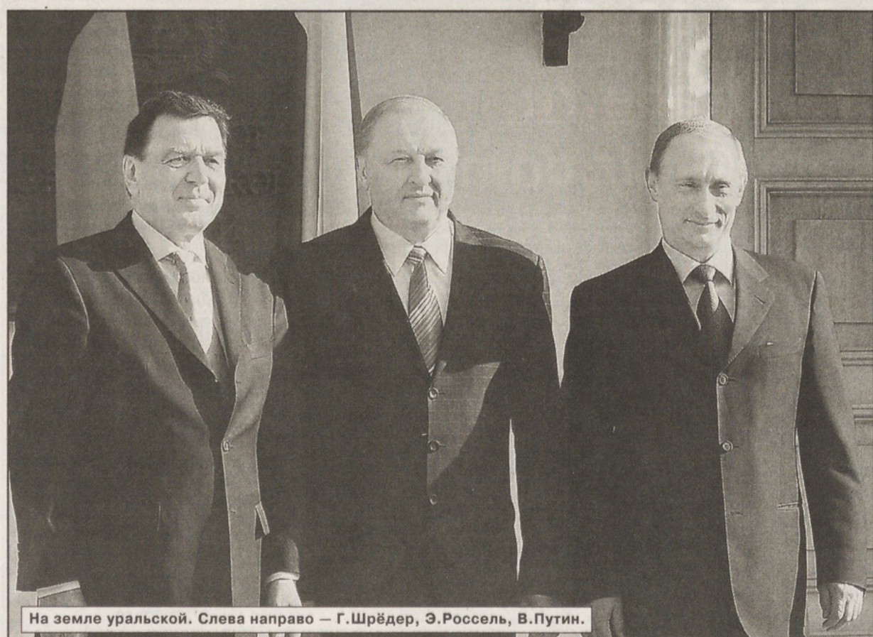
На земле уральской. Слева направо — Г.Шрёдер, Э.Россель, В.Путин.