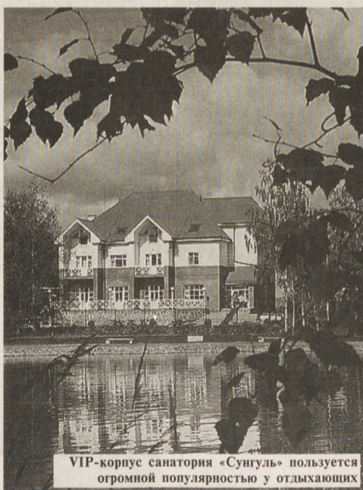
VIP-корпус санатория «Сунгуль» пользуется огромной популярностью у отдыхающих

Та здравница тоже выбрана не случайно. Транспортная доступность: санаторий расположен в 110 км от Екатеринбурга у подножья Вишневых гор на берегу озера Сунгуль. Прекрасные природно-климатические условия, наличие естественных лечебных факторов. Хорошо оснащенная лечебная база, подготовленный в т.ч. и на базе МО «Новая больница» и имеющий обширную практику восстановительного лечения медицинский персонал. Комфортные условия размещения. Возмож-