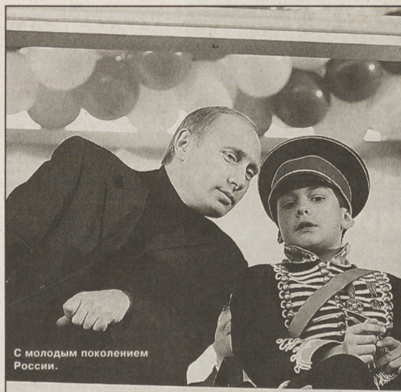
С молодым поколением России.