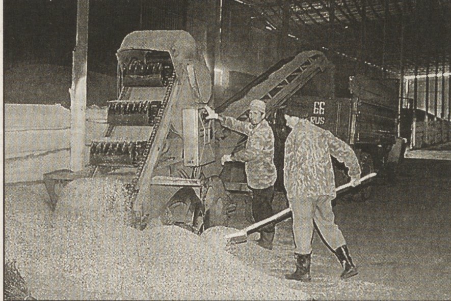
На зерноскладах хозяйства.