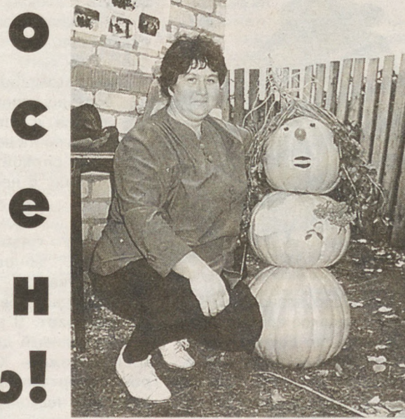
Тыква-снеговик и его создательница на празднике села.

Но все это ничего не значит по сравнению с самим появлением тебя, осень. Ты превращаешь лес в сказку. Как же приятно вдыхать твой влажный воздух! Я долго ждала тебя, глядя в синеву неба и зеленую глубину лесов! Вот ты пришла. И я понимаю, что ты не вечна. Как жаль. Ведь вместе с прохладной погодой и дождями ты принесла к нам в села и деревни много-мно-