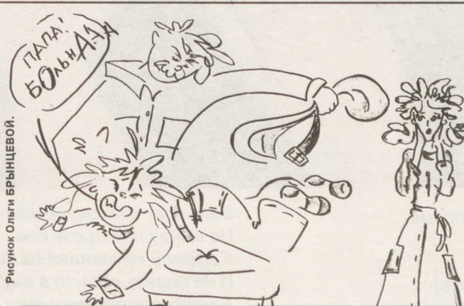
Рисунок Ольги ВРЯНЦЕВОЙ.

Наша школа — цвета солнца, В ней разбитые оконца. Там банановые шкурки, И бутылки, и окурки! После третьего урока Побежали мы в буфет, Тараканов и капусту Подают нам на обед! После сытного обеда, По закону Архимеда, Полагается поспать. В раздевалке есть скамейка, Заменяет нам кровать. Мы немножечко поспали И уроки прогуляли, Теперь пора домой, Попадет нам, ой-ой-ой! Марина САФРОШКИНА, 14 лет.