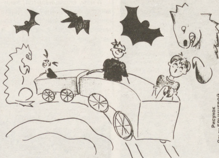
Рисунок Ольги БРЫНЦЕВОЙ.

та и поехали. Заезжаем в темную комнату. Она мне напомнила пещеру. В ней нам встретились динозавры, которые сидели на камнях. Вверху было много летучих